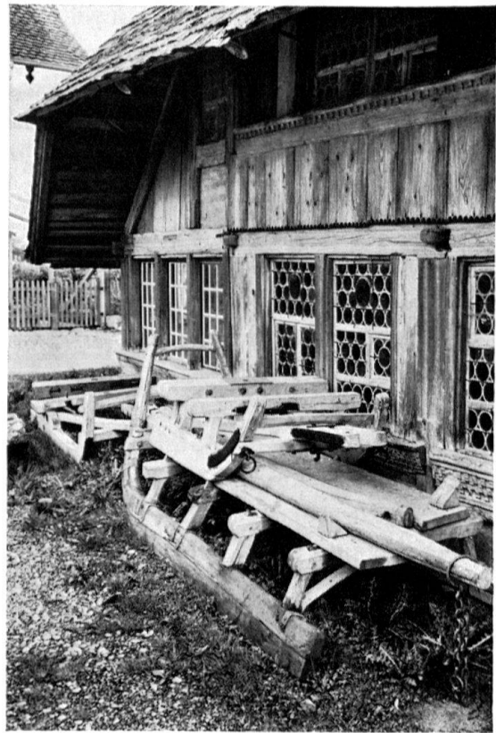
Holzschlitten vor der nördlichen Stubenfront