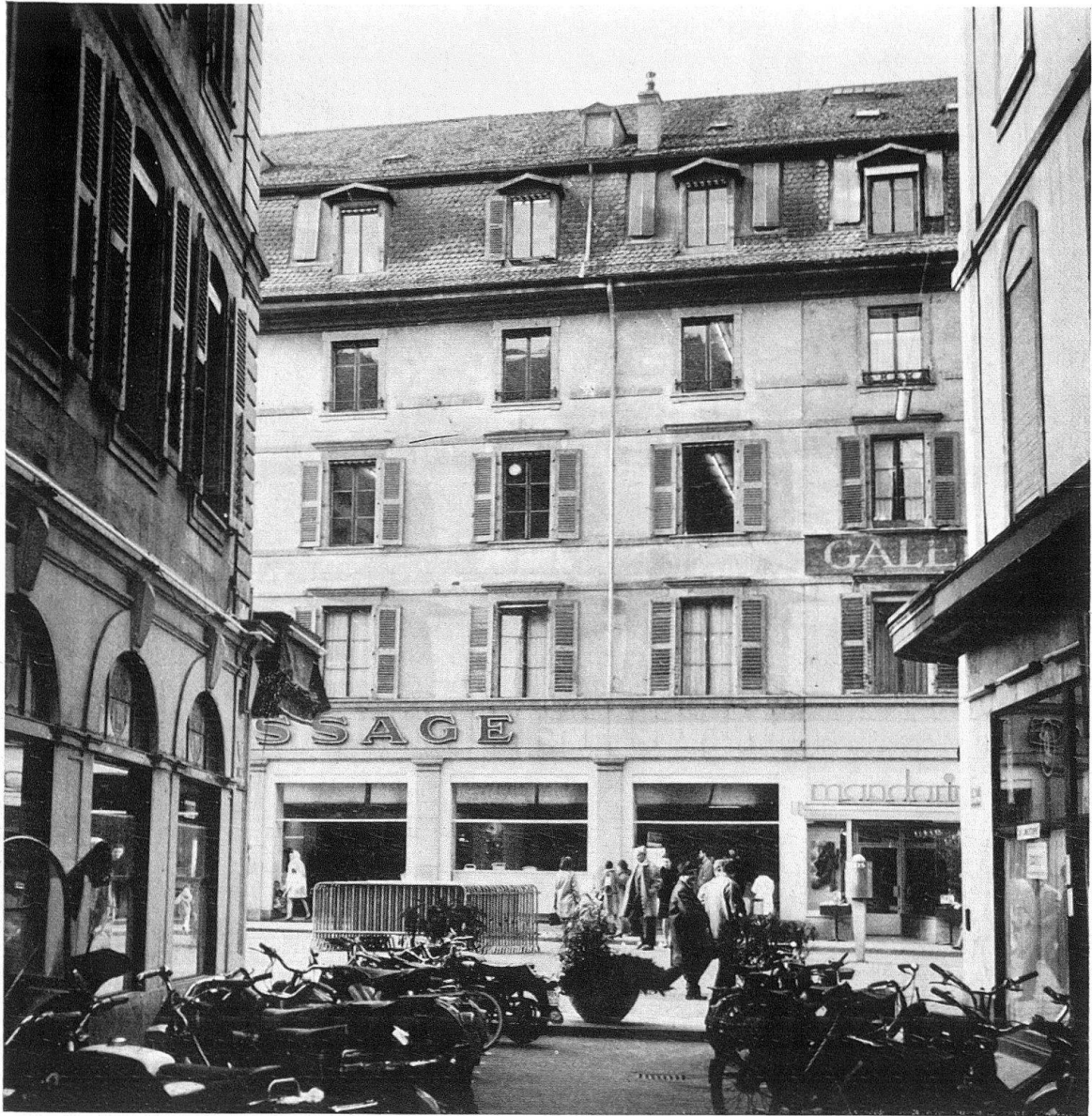
Genève. Le débouché de la Rue Neuve sur le Molard. A gauche le Café du Commerce avec ses arcades intactes; en face, le bâtiment des Halles, rénové à la base pour usage commercial

Il s'agit d'un cas à la fois d'une extrême complexité et d'une extrême importance.