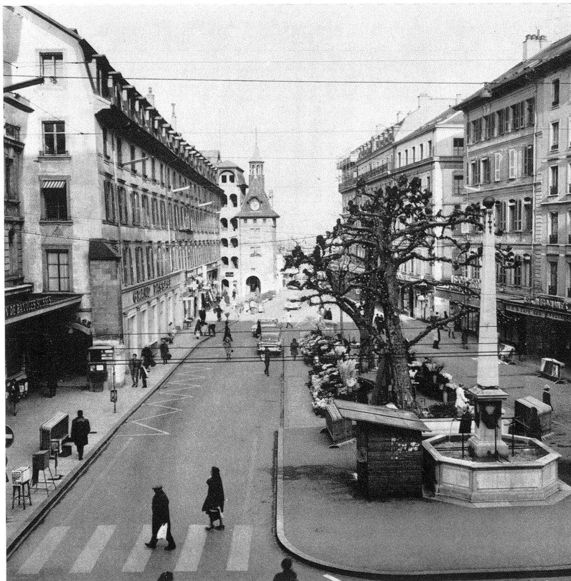
Genève. Le Molard, décembre 1970. A gauche, le bâtiment des Halles, avec sa façade qui penche depuis le temps de sa construction, 1690. – A droite, derrière l'obélisque, le Café du Commerce, bâtiment vieux de deux siècles, café vieux de plus d'un siècle, sous ce même nom

La transformation du centre de Genève depuis une vingtaine d'années nous donne l'exemple d'une série d'intervention désastreuses du point de vue de la continuité du paysage urbain, et particulièrement meurtrières, nous l'avons noté (dans la revue «Werk», 1970, N os 2, 4, 6, 7) pour ce caractère néo-classique qui constituait une grande partie du charme de la