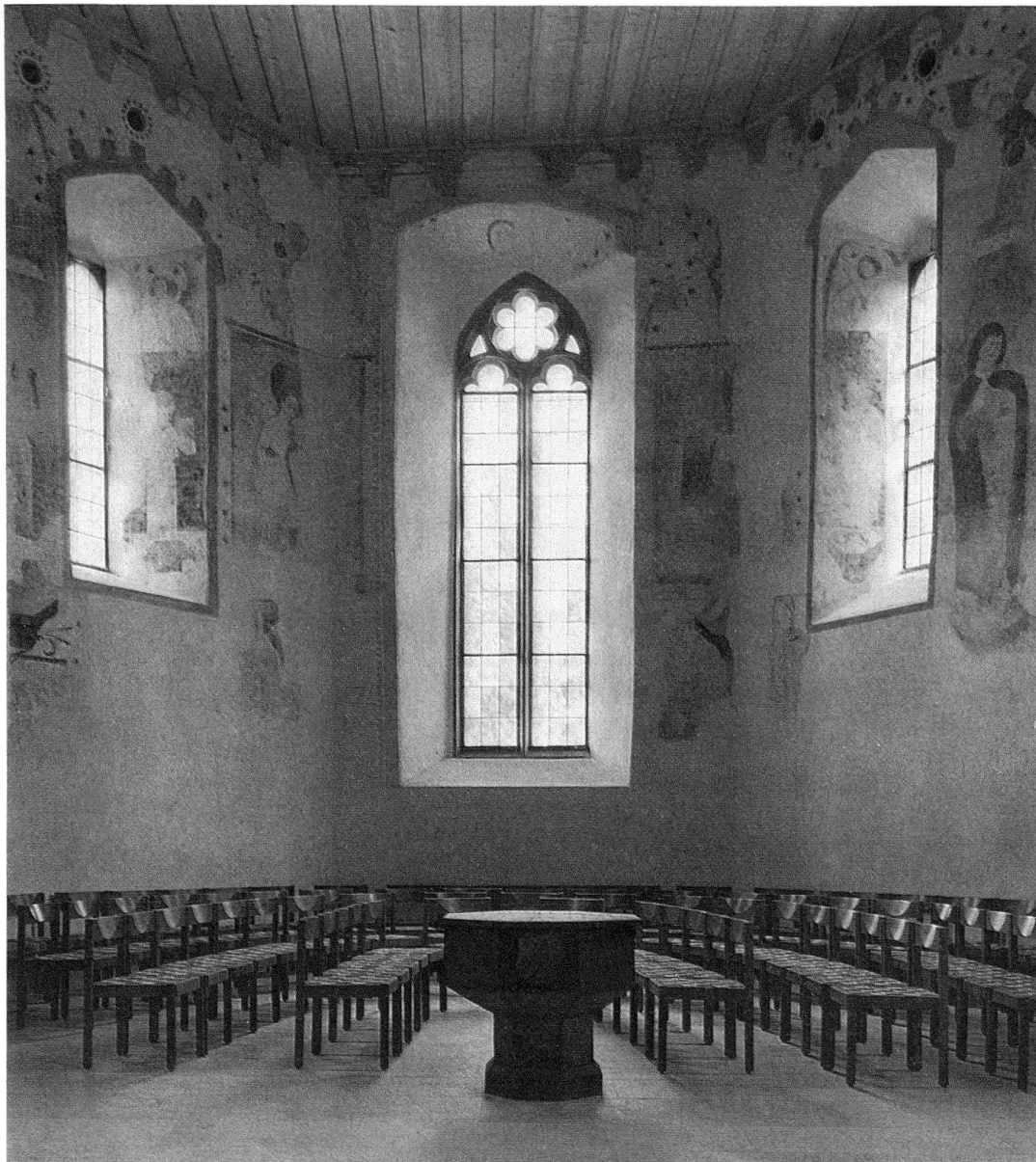
Gelterkinden, Reformierte Kirche. Blick in den Chor mit den neu entdeckten und restaurierten spätgotischen Wandmalereien

Schrägbalkenkreuz, sowie Jakobus der Jüngere mit einer Keule. Auf der linken Seite: Paulus mit Schwert und Buch, Jakobus der Ältere mit Pilgertasche und -stab, Simon mit dem Stabkreuz anstelle der sonst üblichen Säge, und Mattäus mit dem Beil. Die beiden Buchstaben P im Schriftband auf der nördlichen Chorbogenmauer weisen auf den verschwundenen Philippus hin. Der Erhaltungszustand dieser Figuren ist unterschiedlich. Ausdrucksvolle Züge prägen das Gesicht des Apostels Simon. Jenes des Jakobus des Älteren hingegen übernimmt einen Gesichtstypus, der auch bei den Engeln erscheint. Die Gewandstrukturen sind oft nicht mehr zu erkennen, zeigen sich aber dort, wo sie noch lesbar sind, durch reiche Faltenwürfe aus. Die Gestalten der Fensterleibungen besitzen dieselben Merkmale, doch sind sie und ihre Attribute teilweise noch schlechter erhalten. Rechts von