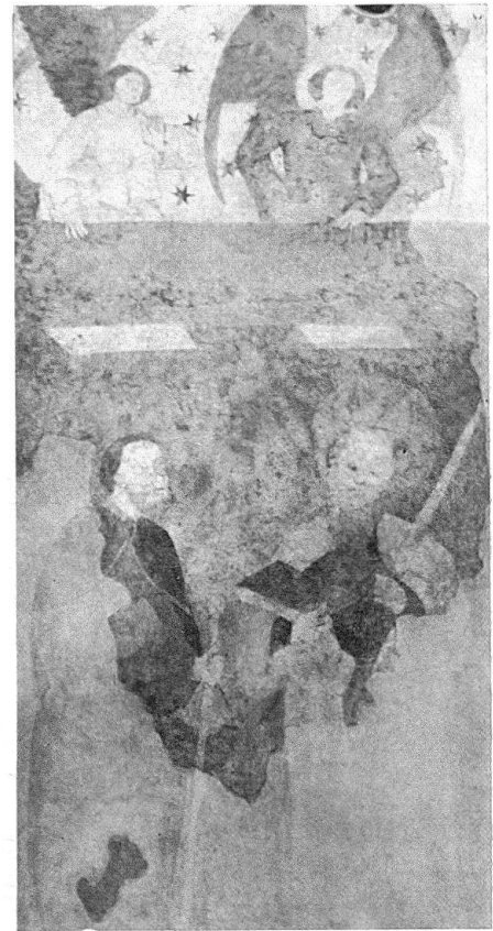
Gelterkinden, Reformierte Kirche. Details der Wandmalereien im Chor: Engel und Heilige (links), Jakobus d. Ae. und Paulus (rechts)

Johannes dem Täufer steht in der Leibung die heilige Margaretha, erkennbar am Drachen zu ihren Füßen. Links von Maria glaubt man eine Figur mit einem Kirchenmodell in der Hand zu sehen, wahrscheinlich Kaiser Heinrich, dessen Namen auch eine Kaplanei der Kirche im 15. Jh. trug. Links davon im gleichen Fenster eine Figur mit einem Hund zu Füßen, vermutlich der heilige Wendelin.