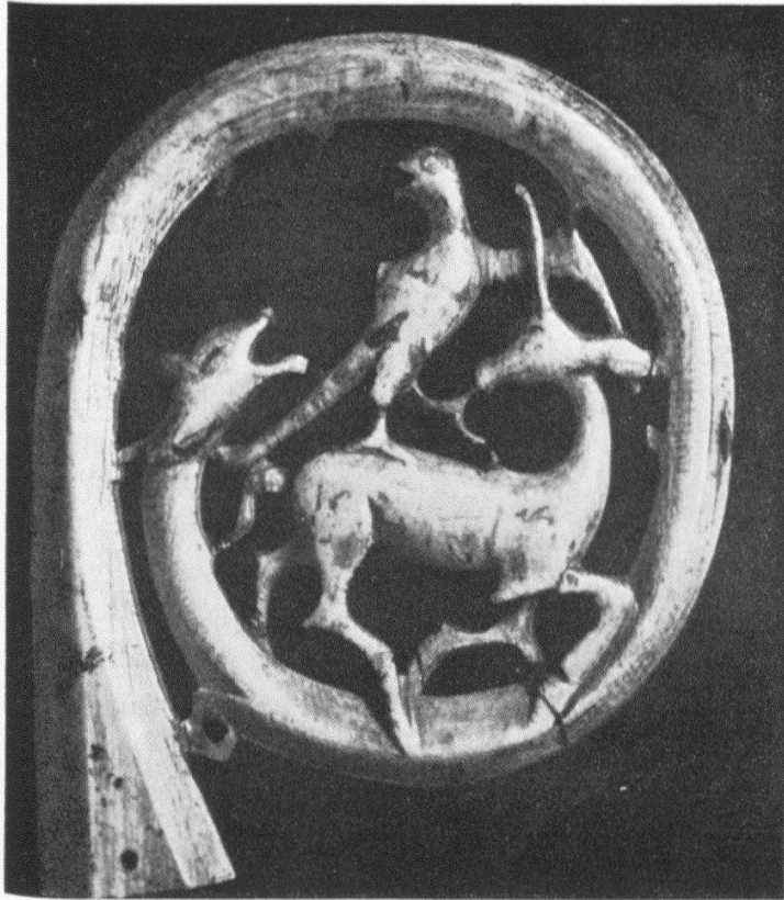
Abb. 2 Sogenannter Uttostab. Pastorale mit Elfenbeinkrümme, vergoldeter Bronzefassung, Knauf aus Bergkristall und Stab aus Eichenholz. Kurz nach 1200. Metten (Bayern), Abtei.