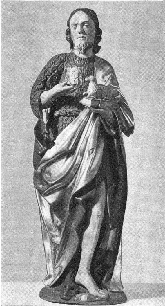
Abb. 3. Johannesfigur mit Freilegungsproben