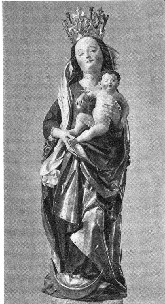
Abb. 4. Die bereits fertig restaurierte Marienfigur

übertreffen. In solchen Fällen wird die Entscheidung, welche Schicht zu opfern und welche freizulegen ist, zum Dilemma, vor allem, wenn das Original nur sehr reduziert erhalten ist. Im Falle der Fassung Ivo Strigels aber bestand keine Alternative zur ursprünglichen Bemalung: der Altersabstand der Nachfassungen beträgt gegenüber dem Original mehrere hundert Jahre, und die Qualität der gotischen Polychromie erhebt sich weit über die spätzeitliche Übermalung. Der Aufwand, den es zu ihrer Freilegung bedarf, ist freilich außerordentlich. Nur ein Lehratelier mit einem Team von geschulten Fachkräften und sorgfältig geführten und minutiös arbeitenden Restaurierschülern vermag eine derartige Arbeit zurzeit zu bewältigen, ohne daß die Kosten allzu hoch würden.