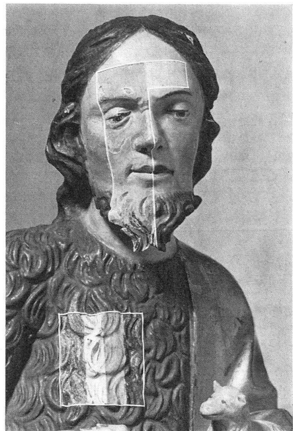
Abb. 2. Abschnitzungen am Kopf der Johannes- figur zerstörten die gotische Linienführung von Haar und Bart. Gesicht teilweise zerstört. Originalpolychromie und Schnitzholz liegen im senkrechten Feld frei. Oben rechts Freilegungs- stufen. Das übrige Gesicht noch übermalt