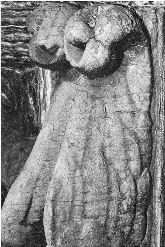
Abb. 4. Haus «Zum Schwanen», Engelsflügel. Schnitzwerk durch bis zu fünf Fassungen vollständig verdeckt. Farbschichten mit vielen Rissen und zum Teil abblättern