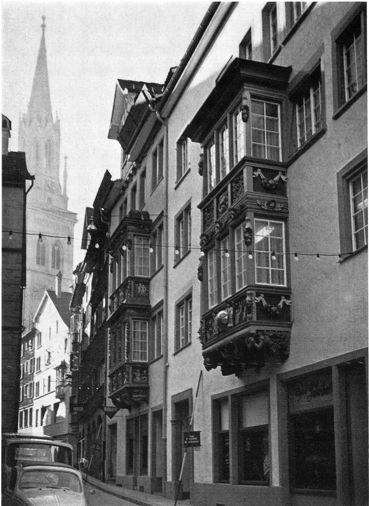
Abb. 1. St. Gallen, Kugelgasse mit den Häusern «Zur Kugel» (rechts) und «Zum Schwanen» (Mitte), im Hintergrund der neugotische Turm der Kirche St. Laurenzen