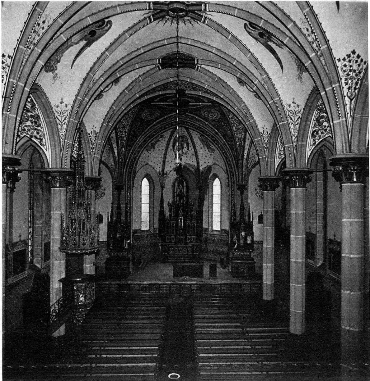
Abb. 3. Goßau, Jugendkirche, Inneres gegen Vierung und Chor vor dem Abbruch

Die Jugendkirche in Goßau ist nicht mehr. Bald wird an ihrer Stelle ein Pfarreiheim entstehen, das gewiß keine Rücksicht auf die heutige Umgebung nehmen wird, ebenso wenig wie ein bereits realisierter, kaltschnäuziger Wohnblock. Die meisten herrschaftlichen Villen ringsum aus dem späten 19. Jahrhundert sind dem Vernehmen nach dem Abbruch geweiht. Ein vor wenigen Jahren noch intaktes Wohnviertel des Historismus, zu welchem auch das Gallusschulhaus von 1890 gehört, wird systematisch umgekrempelt. Immerhin wird eine Villa dank einer günstigen Handänderung die Abbruchwelle überdauern: das um 1900 von August Hardegger gebaute Haus zum Bürgli, dessen reichskulptiertes Neurenaissanceportal, die Erker, die phantasievolle Riegelstruktur, aber auch die behäbigen Boiserien im Innern von der Liebe zur Kunst und zum Prunk der guten