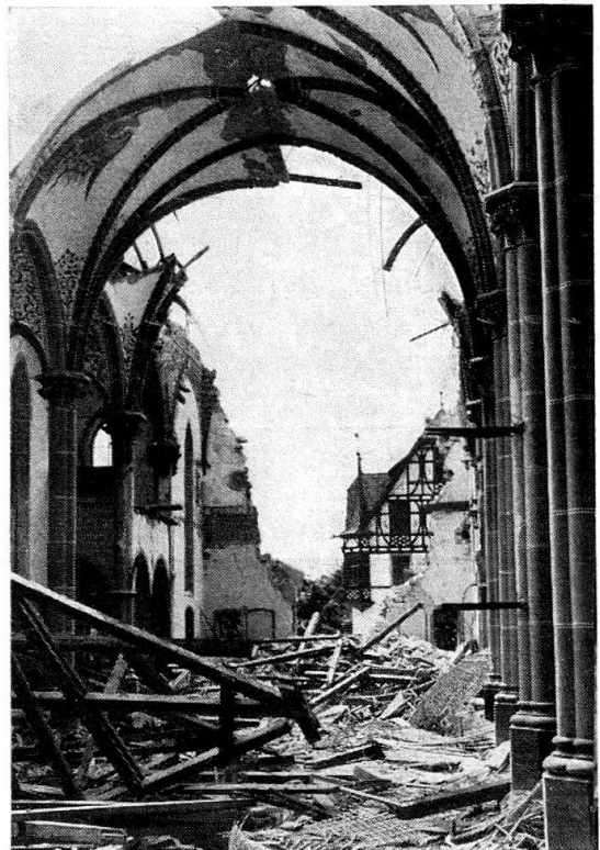
Abb. 2. Goßau, Jugendkirche, Inneres gegen den Eingang nach Abbruch von Teilen der Empore