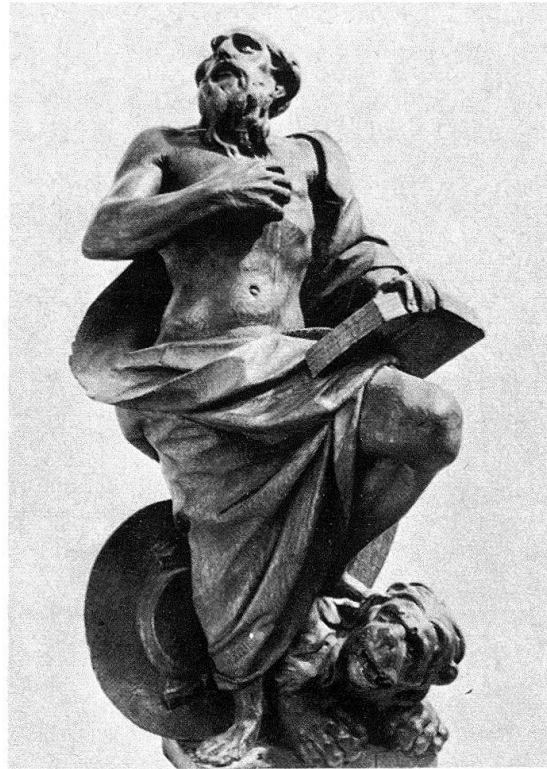
◀ Abb. 8. Simon Bachmann: Chorgestühl der Klosterkirche Muri, Detail. Um 1655/1660