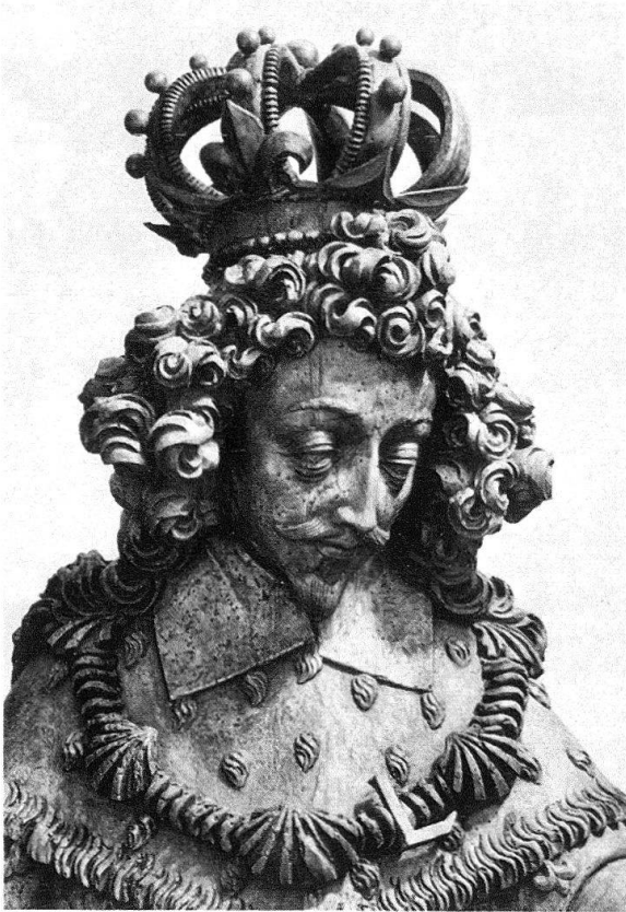
Abb. 3. Hans Ulrich Raeber: Hl. Ludwig vom Chorgestühl der Franziskanerkirche in Luzern, um 1644/1651