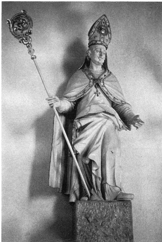
Abb. 6. Michael Hartmann: Statue (wohl Kirchenvater) vom ehemaligen Hochaltar des Domes in Arlesheim, 1681. Pfarrkirche Schliengen (Baden-Württemberg)