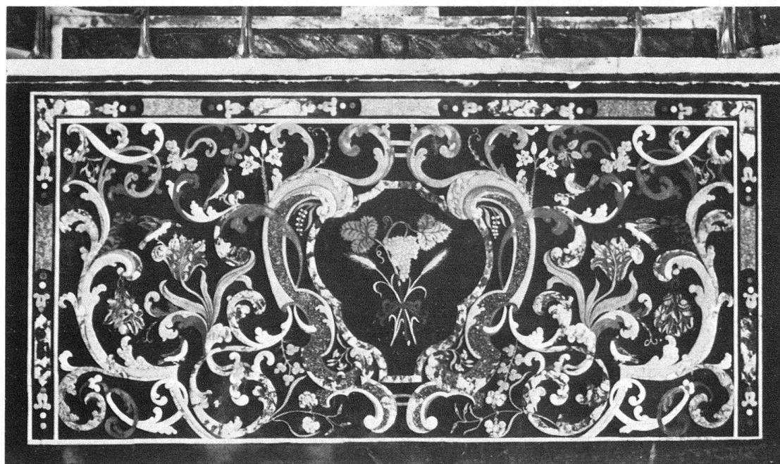
Ill. 2. Montecarasso, Chiesa della Trinità. Paliotto a lastra unica, firmato da Giuseppe Maria Pancaldi

La struttura decorativa è piuttosto semplice e comprende una cornice generale più o meno larga a motivi geometrici (tranne per uno dei tipi di paliotti a tre specchi citato sopra), un motivo centrale e un motivo decorativo che si sviluppa specialmente ai due lati.