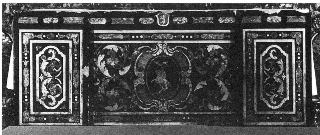
Ill. 1. Muralto, San Vittore. Paliotto tripartito dell'altar maggiore, del 1741 circa, attribuito a Giuseppe Maria Pancaldi

Nella regione lombarda opere in scagliola che interessano il nostro lavoro sono note dopo la metà del '600 3 . Da noi il massimo sviluppo è raggiunto nel Settecento e precisamente dal 1720 al 1780 circa.