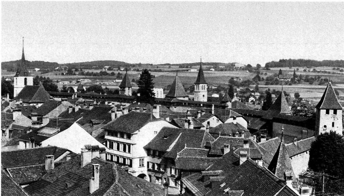
Blick vom Schloss Murten auf die Stadtteile und -mauer im Osten bis zur Deutschen Kirche (linker Bildrand).

Die grosse Zahl der Teilnehmer an den Stadtführungen und Exkursionen zwingt zu