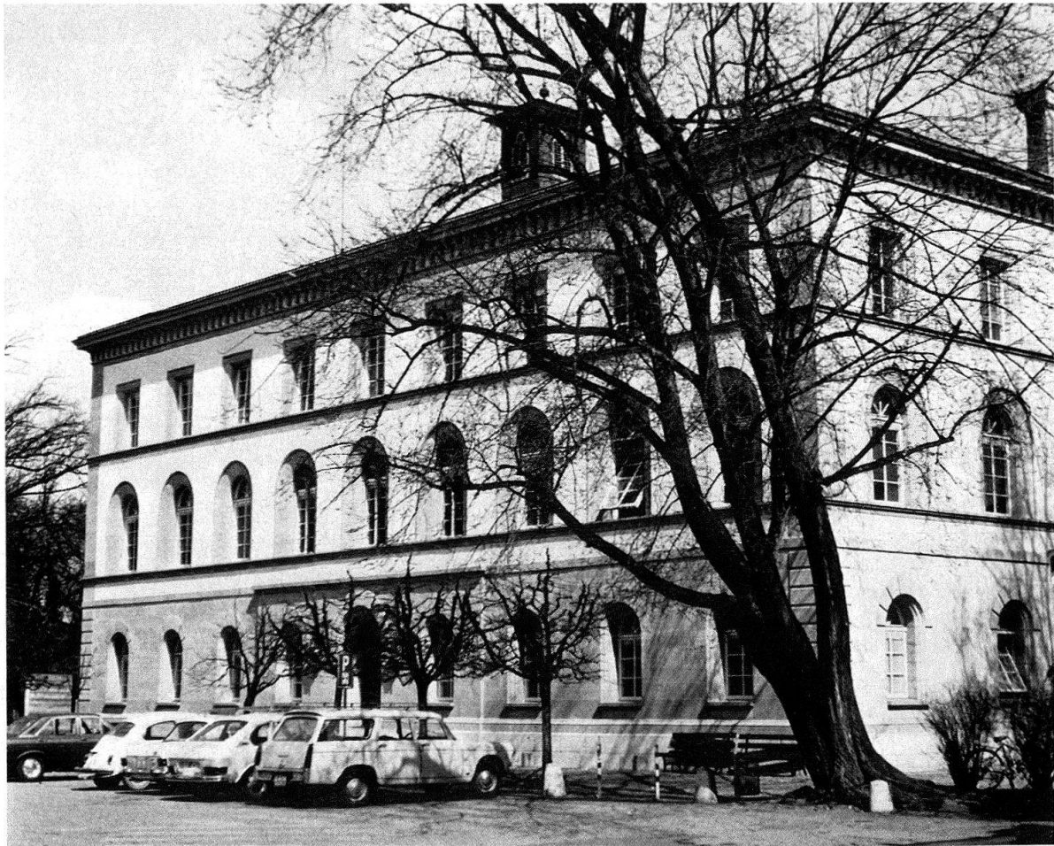
Murten. Das Schulhaus von Johann Jakob Weibel, erbaut 1836–1839; Hauptfassade

als die erste Bedingung einer gründlichen Reform im Schulwesen dargestellt hat. Die politischen Verhältnisse würden es Murten zur unerlässlichen Pflicht machen, «durch fortschreitende Verbesserung des Unterrichts die Jugend so heranzubilden, dass Männer aus ihr hervorgehen können, welche im Stande seien, die Ehre der Vaterstadt aufrecht, und ihre Rechte gegenüber den Anmassungen der Landgemeinden überhaupt, wie der Regierung insbesondere mit Geschicklichkeit und Kraft zu verteidigen» 5 . Freiburg und Murten begegneten sich nach 1803 aus weltanschaulichen Gründen zunächst misstrauisch bis feindselig, und die rechtliche Sonderstellung der Stadt im Bezirk wurde durch die neue Gesetzgebung erheblich abgebaut. Selbsthilfe war naheliegend.