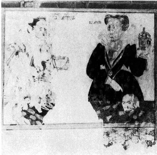
◀ 2. Burgdorf, Malereizyklus 4. Viertel 16. Jh. Kleopatra (links) und Personifikation des Respice-Finem-Gedankens (rechts)