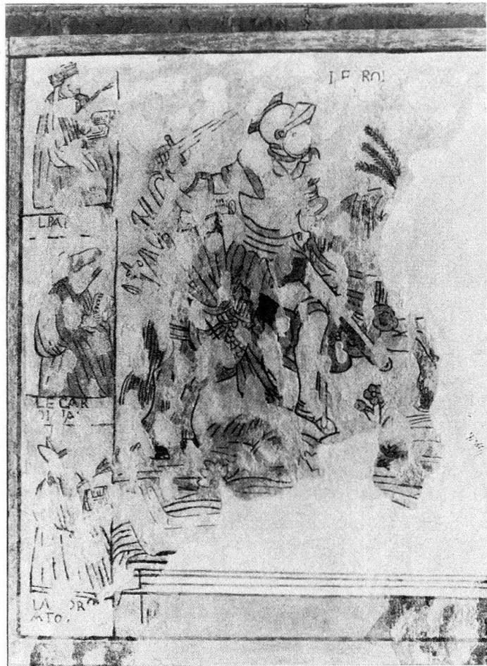
1. Burgdorf, ehem. Hohengasse 23, jetzt Schloss, Malereizyklus 4. Viertel 16. Jh. Mittelbild, linke Hälfte: Ritter im Kampf gegen den Tod. Am Rand Standesfolge von Papst bis Bischof

Auf der rechten Seite des Mittelbildes ist nur eine einzige, dafür ausführlichere Szene geschildert: die Sebastiansmarter. Die Erschiessung geht auf einem Platz im Inneren der Stadt Rom vor sich, die mit Wehrmauer, zwei Häusern und Fluss charakterisiert ist. Der Heilige lehnt halb in die Knie gesunken an einen Baum. Zwei Pfeile haben ihn in der Herzgegend getroffen. Die rechte Bildhälfte nimmt eine Reitergruppe ein, aus welcher deutlich eine Gestalt mit befehlshaberisch erhobener Hand herausragt. Es ist Diokletian mit Söhnen und Gefolge, der eben zwei Schützen mit schussbereiten Bogen weitere Befehle erteilt. – Im Zwickelfeld schliesslich erkennt man neben Blattranken ein baldachinartiges Zelt.