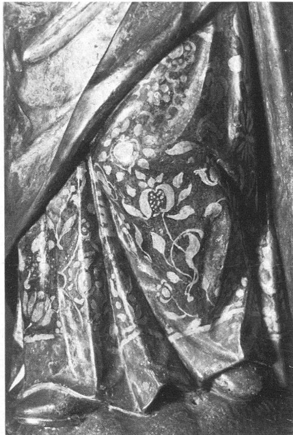
Mülinen bei Tuggen. Abb. 3 (links): Hl. Katharina aus dem Holzretabel, letztes Viertel 17. Jh. – Abb. 4 (rechts): Hl. Magdalena, Detail aus dem Unterergewand

die farblich verschieden behandelten Flächen der Bekleidungsstücke einander gegenüberzustellen, sondern er bevorzugt die Belebung irgendeines Gewandteils durch aufgemalte Ornamente bzw. durch die Wiedergabe eines Stoffmusters. Dabei kann es sich um das Obergewand, das Unterergewand oder die Mantelinnenseite handeln. Die Aussenseite der Mäntel ist immer in Polimentvergoldung gefasst; die dekorativen Motive sind sehr verschieden und phantasievoll. Am meisten vertreten sind pflanzliche Motive (Ranken, Blüten, Blätter, Granatapfel), aber auch sehr feine oder sehr breite Streifenmuster sowie Sterne kommen vor.