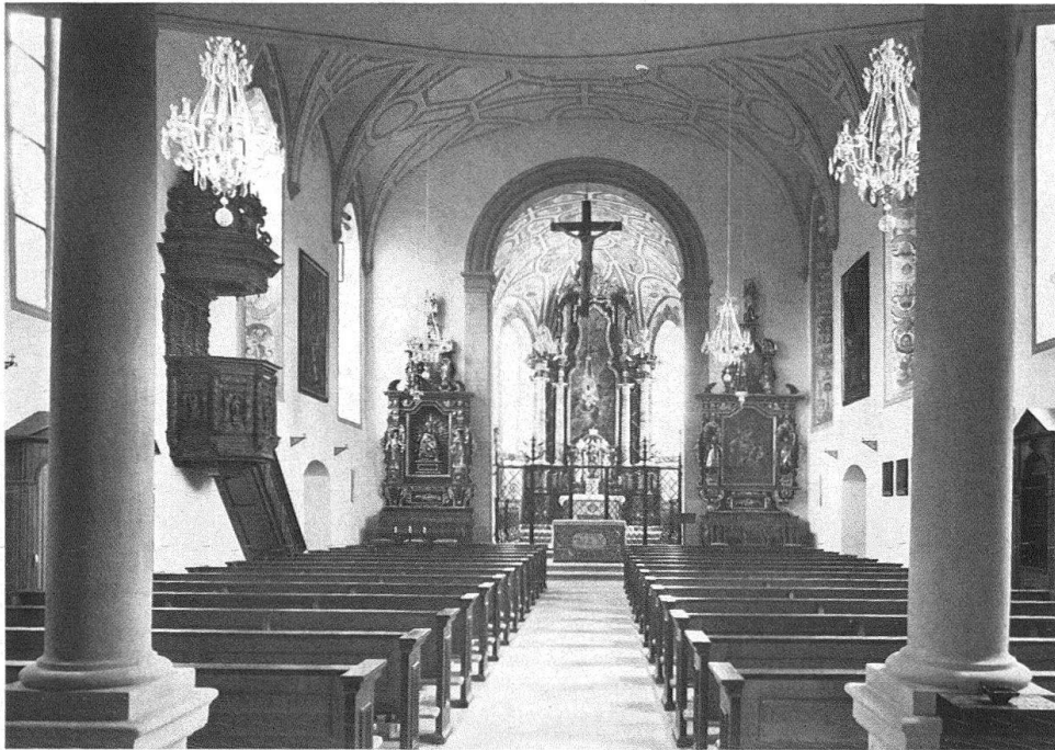
Werthenstein. Wallfahrts- und Pfarrkirche Unserer lieben Frau. Auf der Seite 65: Blick aus dem Chor gegen die Eingangsseite, oben das Innere gegen den Chor

Dass am 8. Februar 1826 das Tuffsteingewölbe des Kirchenschiffes von Werthenstein eingestürzt ist, die Decken-Dekoration zerschmetternd, Altäre, Kanzel, Beichtstühle und Bänke zertrümmernd, hat nicht nur als Zufall zu gelten. So manches war – nach frommem Beginn um 1500 und nach frohem Baubetrieb zwischen 1608 und 1692 – zusammengefallen. Das alte Regime, die Gründer und Pfleger des Marien-Heiligtums ob dem Emme-Knie, hatte der Sturm Napoleons hinweggefegt und trotz Rüttimanns Restaurations-Künsten von 1814 nicht mehr zurückgebracht; die Wallfahrten mit ihren Tausenden von Betern wurden nicht mehr zum Fest des Jahres, die aussterbenden Franziskaner hatten eher Vergangenes zu hüten als Gegenwärtiges zu horten. Und so durfte nur eben geflickt werden, um dem Landvolk den Messdienst zu gönnen: ein Lattengewölbe über billigen Retabeln, eine magere Stuckkanzel und enges Gestühl.