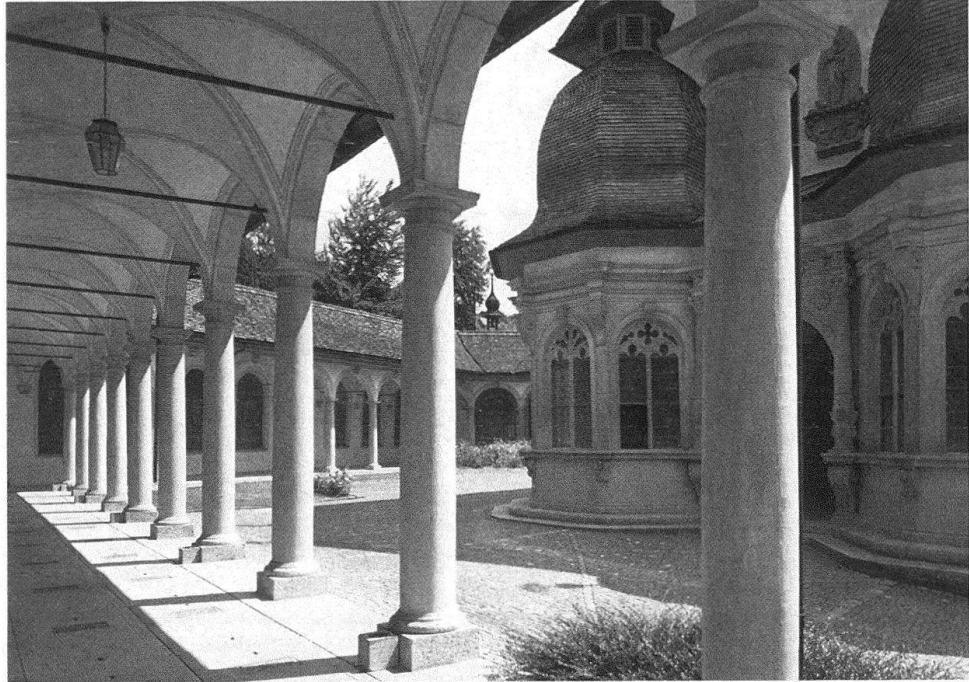
Werthenstein. Der 1635/36 durch Ulrich Traber nach einem Modell von Niklaus Geisler errichtete Kreuzgang ist ein Meisterwerk der Renaissance-Architektur in der Schweiz

derte die Renaissance des damals noch gar nicht so hochgelobten Barock. Der Restaurierungsbeginn von 1913 und die Fortführung von 1925–1931 erwiesen sich dann freilich als Teilunfall. Die problematische Behandlung der Reinhart-Malereien im Kreuzgang erbrachte nicht unberechtigte Einwände. Die Wiederaufnahme der Arbeiten um 1953 galt der Aussen-Renovation des Kirchenschiffes – leider unter Einbusse des reichen Pfyffer-Epitaphs bei nur dürftigem Ersatz. 1960–1962 kamen Chorfassaden und Gräberhallen an die Reihe. Aber der Schiffsraum als der eigentliche Ernstfall blieb noch unberührt.