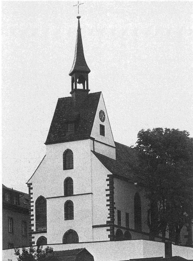
Chrischonakirche. Der in die Westseite eingebundene Käsbissenturm mit Glockenreiter