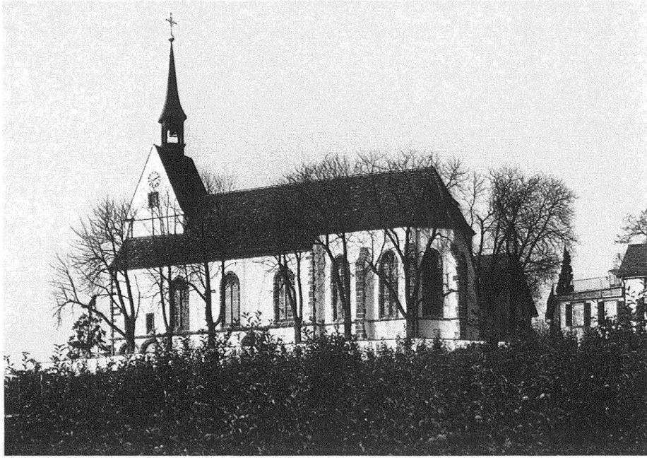
Weit grüsst die Chrischonakirche vom höchsten Punkt des Kantons Basel-Stadt, vom Dinkelberg, ins Land hinaus

Mauern entfeuchtet, der Verputz erneuert, verdorbene Sandsteinwerkstücke ausgewechselt, artfremde Baustoffe – vor allem Granit – durch herkömmliches Material ersetzt werden. Jetzt trägt das Äussere der Kirche wieder seine angestammte prägnante Farbgebung: den Dreiklang aus heller Verputzfarbe, rotem Sandstein der bearbeiteten Werkstücke und ziegelfarbener Dachhaut.