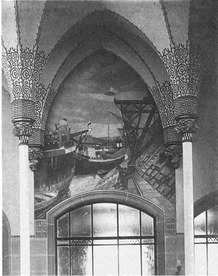
Basel. Hauptpost. Die Schalterhalle nach Abschluss der Restaurierung, 1977