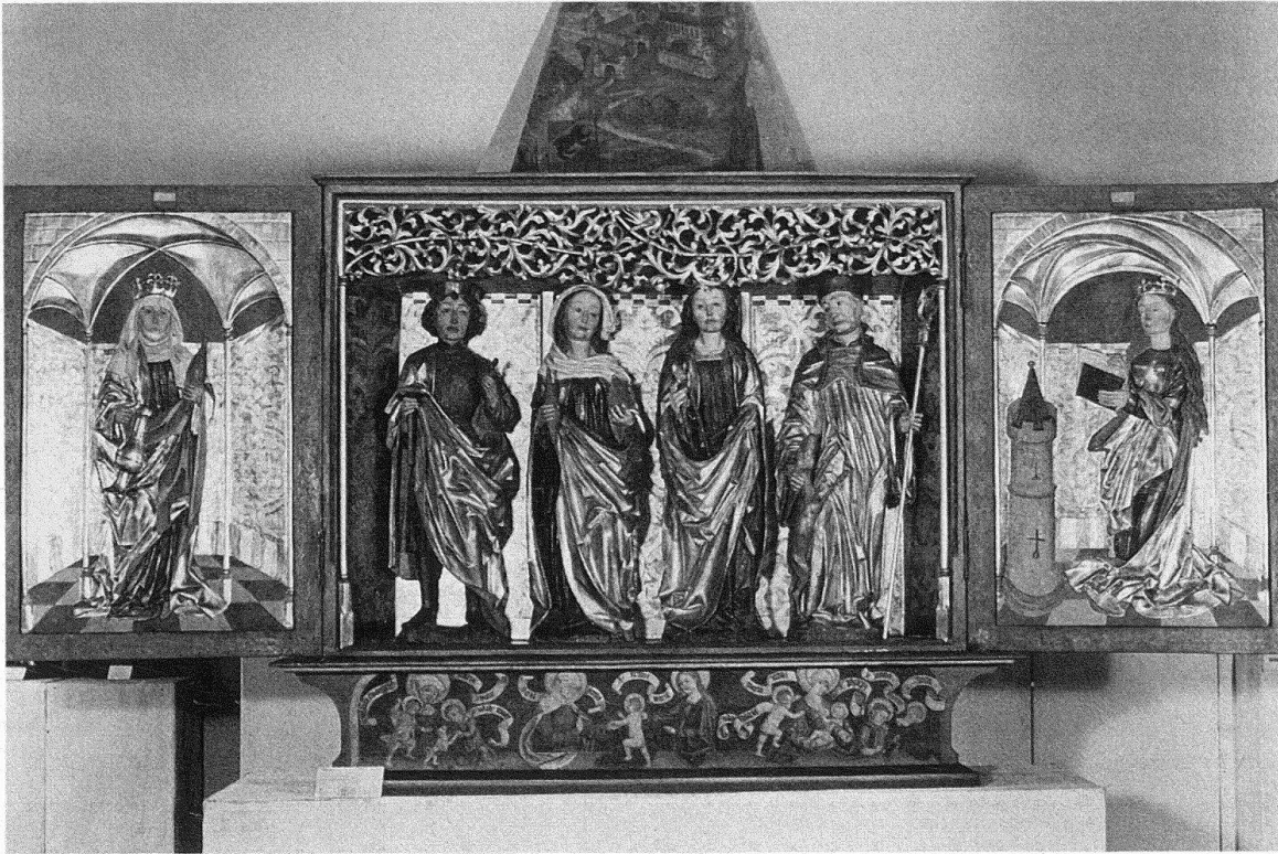
Schloss Lenzburg. Kant. historische Sammlung. Gesamtansicht des Herznacher-Altars, 1516

mit verbundene Herausgabe einer Publikationsreihe wie die Aktivitäten mit Kindern haben durch ihre Erfolge bewiesen, dass das Museum auf der Lenzburg am richtigen Ort ist. In der Tat treffen bei diesem Standort so viele vorteilhafte Momente zusammen, dass sich dem Kantonalen Museum alle Chancen überregionalen Wirkens auf tun. Da ist der Standort ausserhalb einer Stadt, doch nahe grosser Agglomerationen. Da ist die günstige Verkehrslage in unmittelbarer Nähe der Nationalstrasse. Da ist vor allem das hügelbegründete Schloss mit seiner imposanten Silhouette, dem weiten Innenhof, dem grosszügigen Garten, dem malerischen Ensemble verschiedenartiger Bauten und der unterhaltsamen Abfolge der Ausstellungsräumlichkeiten mit verwinkelten Zu- und Abgängen, mit Treppen, Türmchen, Rosengarten, sich immer ändernden Durch- und Ausblicken. Da ist schliesslich eine Sammlung, die allem vergangenen Unbill zum Trotz so viel Substanz enthält, dass sie zu einer abwechslungsreichen Schau gestaltet werden kann: Möbel, Zinn, Glasmalerei, Plastiken, Textilien, Schmiedeisen, Waffen, Zeugnisse religiöser Volkskunst, Keramik, Edelmetall, Hausgeräte usf. Mit einer Auswahl des Besten werden die geplanten zwei Abteilungen « Sachgruppensammlung » und « Epochemuseum » gestaltet. Versteht sich, dass die Neupräsentation nur der erste, die systematische Erweiterung der Sammlung der nächste Schritt sein wird.