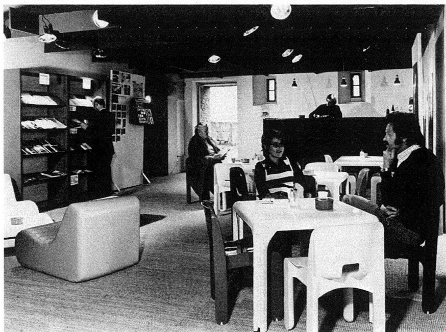
Schloss Lenzburg. In der Cafeteria, kombiniert mit interessanter Literatur aus der Buchhandlung, lässt sich trefflich diskutieren und ausruhen

Mit der Schaffung eines soliden technischen und wissenschaftlichen Fundamentes, mit einer viergliedrigen Ausstellungsinszenierung, mit vielen besucherkonformen Erleichterungen, mit der Fortsetzung bisheriger und der Aufnahme neuer Aktivitäten sollte – die Vorteile des Standortes noch dazu genommen – ein Museum entstehen, das dem Kulturkanton angemessen ist.