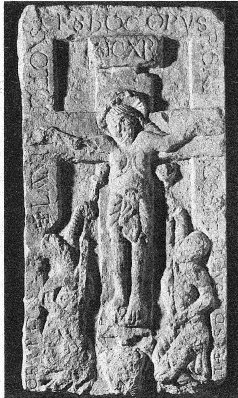
Schloss Lenzburg. Kant. historische Sammlung. Herzacher Relief, 10. Jh.

stätten. Alles in allem fundamentale Verbesserungen , die den Weg ebnen, um das vorhandene Sammlungsgut zur Geltung zu bringen.