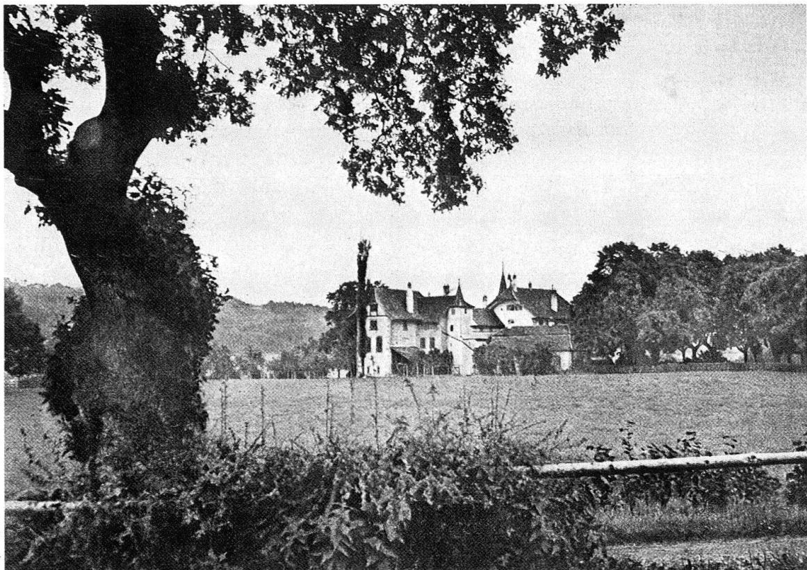
Bern. «Murifeld». Freihaltezone am Puffertgässchen mit Blick auf das Schloss Wittigkofen. – Gemäss Bauordnung galt das gesamte Gebiet als potentielles Bauland. Auf Grund der Planung ist der Landsitz nunmehr inmitten des ausgeschiedenen unüberbaubaren Landschaftsreservates gelegen. Der hier wiedergegebene Anblick von Schloss und Umgebung bleibt unberührt

Das Ziel war, die wirksame Lenkung der Verhältnisse im Verband eines Stadtteils in den Griff zu bekommen und derart den Ansatz einer städtebaulichen Integration zu bilden. Mit Bezugnahme auf die topographischen Gegebenheiten und die Lage der Landsitze, insbesondere auf das zentral gelegene Schloss Wittigkofen, sah nun die Planung vor, ein landschaftliches Reservat auszuscheiden und die verbleibende Fläche in