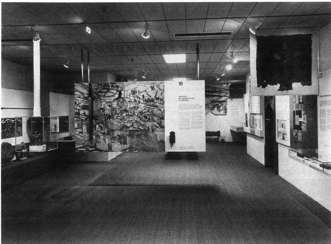
Abb. 8. Basel, Barfüsserkirche. Historisches Museum. Jüngere Stadtgeschichte nach 1200