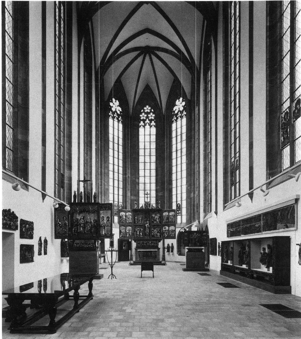
Abb. 6. Basel, Barfüsserkirche. Historisches Museum, Blick in den Chor mit kirchlicher Kunst der Gotik, 1981

fanden 19 Fragmente des einst weltberühmten Totentanzfreskos an der Kreuzgangmauer des Dominikanerklosters einen würdigen Rahmen; sie hingen früher, weit von den Blicken des Besuchers, an den Brüstungsgeländern der Seitenschiffemporen. Auf der Lettnerempore sind die kostbarsten nichtbaslerischen Objekte des 13. bis 15. Jahrhunderts vereinigt, zugleich bietet dieser Punkt einen herrlichen Blick in den Chor und durch das weite Kirchenschiff. Der Chor selbst birgt nun um den im Blickpunkt stehenden, 1512 datierten Hochaltar des Yvo Strigel aus Sta. Maria di Calanca ausschliesslich kirchliche Kunst der Gotik : Skulpturen, Wirkteppiche und Glasgemälde. Das früher in zwei grossen Vitrinen hinter dem Hochaltar zusammengenommene kleinere Kultgerät