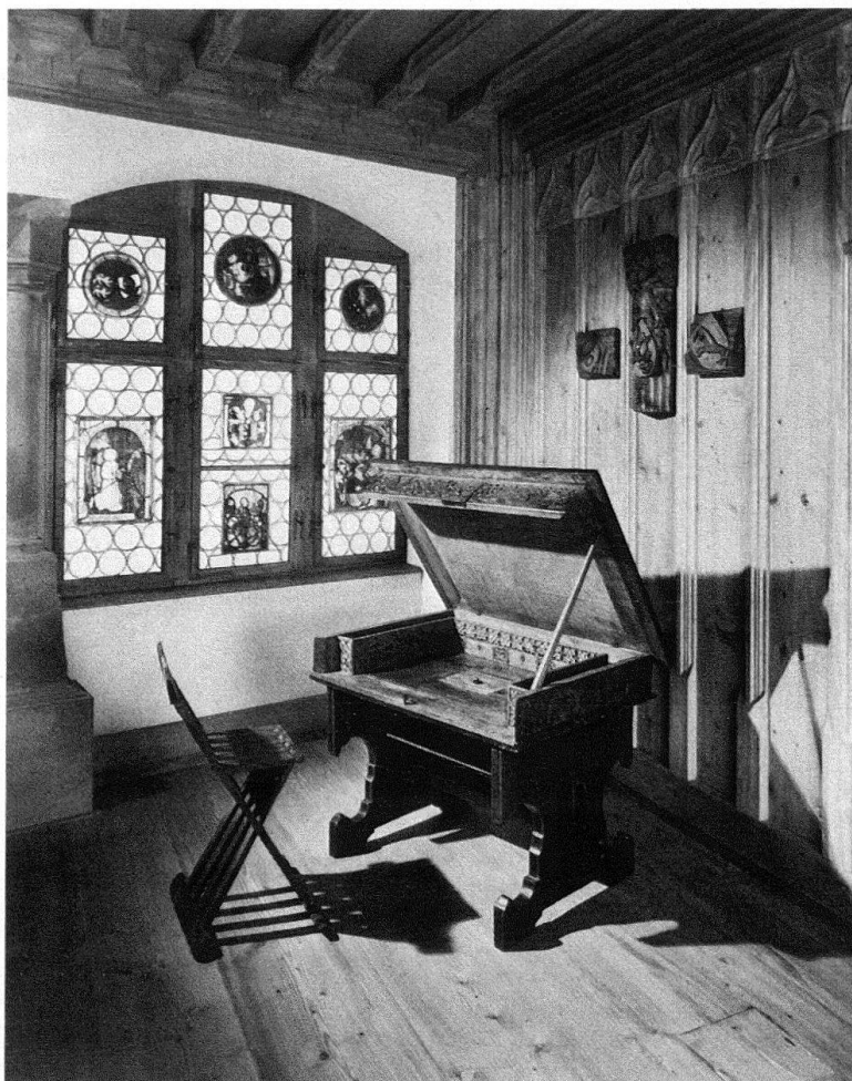
Abb. 7. Basel, Barfüsserkirche. Historisches Museum. Gotisches Zimmer mit Täfer aus dem Haus zum Cardinal

Neben dieser konzentrierten Darstellung möglichst vieler Aspekte der Basler Stadtgeschichte vermitteln stilgerecht eingerichtete historische Zimmer der Gotik, der Renaissance und des Barocks ein anschauliches Bild jeweiliger Lebensart, allerdings der erhaltenen Objekte wegen nur der obersten sozialen Schicht.