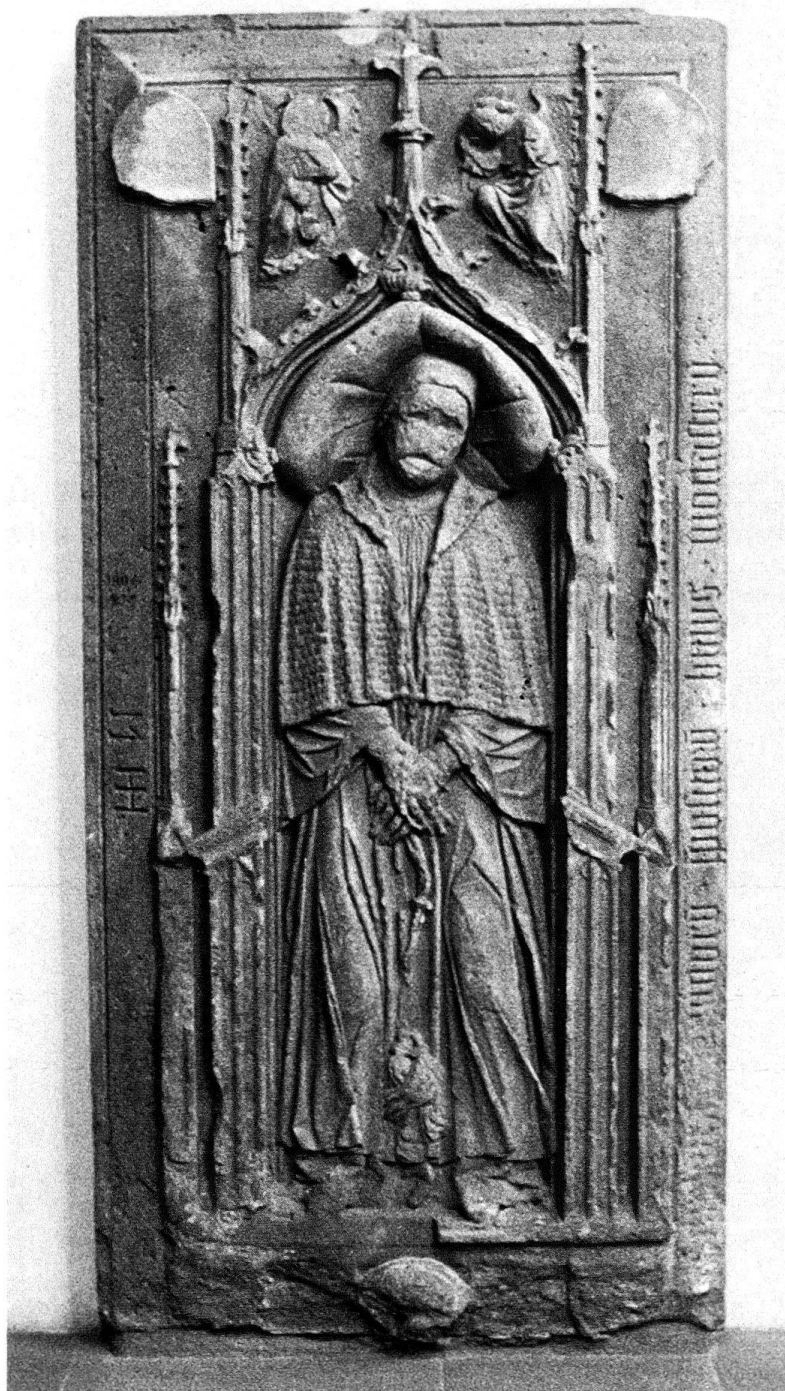
Abb. 1. St. Leonhard in Basel, Grabmal der Pröpste, um 1500

sollte nicht einfach verschwinden, sondern bleiben als versteinertes Souvenir der Eitelkeiten hoher Herren von einst. Die haben übrigens schon 1440 die anderen Chorherren Basels provoziert durch ihre besonders reiche Kleidung 4 .