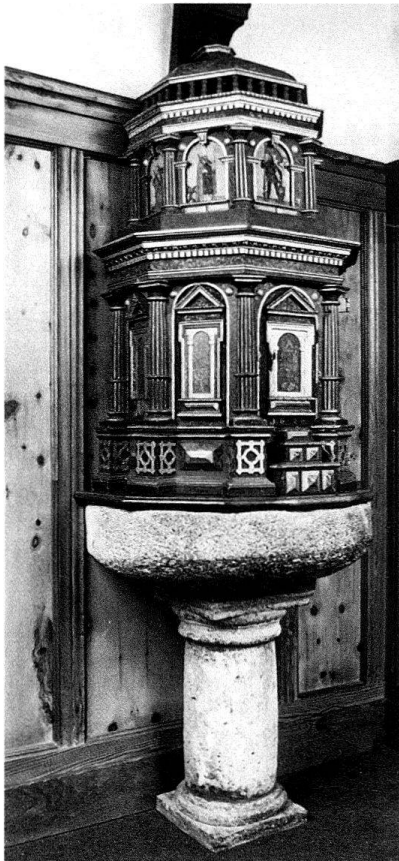
Fig. 1. Colonges, église paroissiale, fonts baptismaux avec couvercle, ancien tabernacle de l'abbatiale de Saint-Maurice, 1620