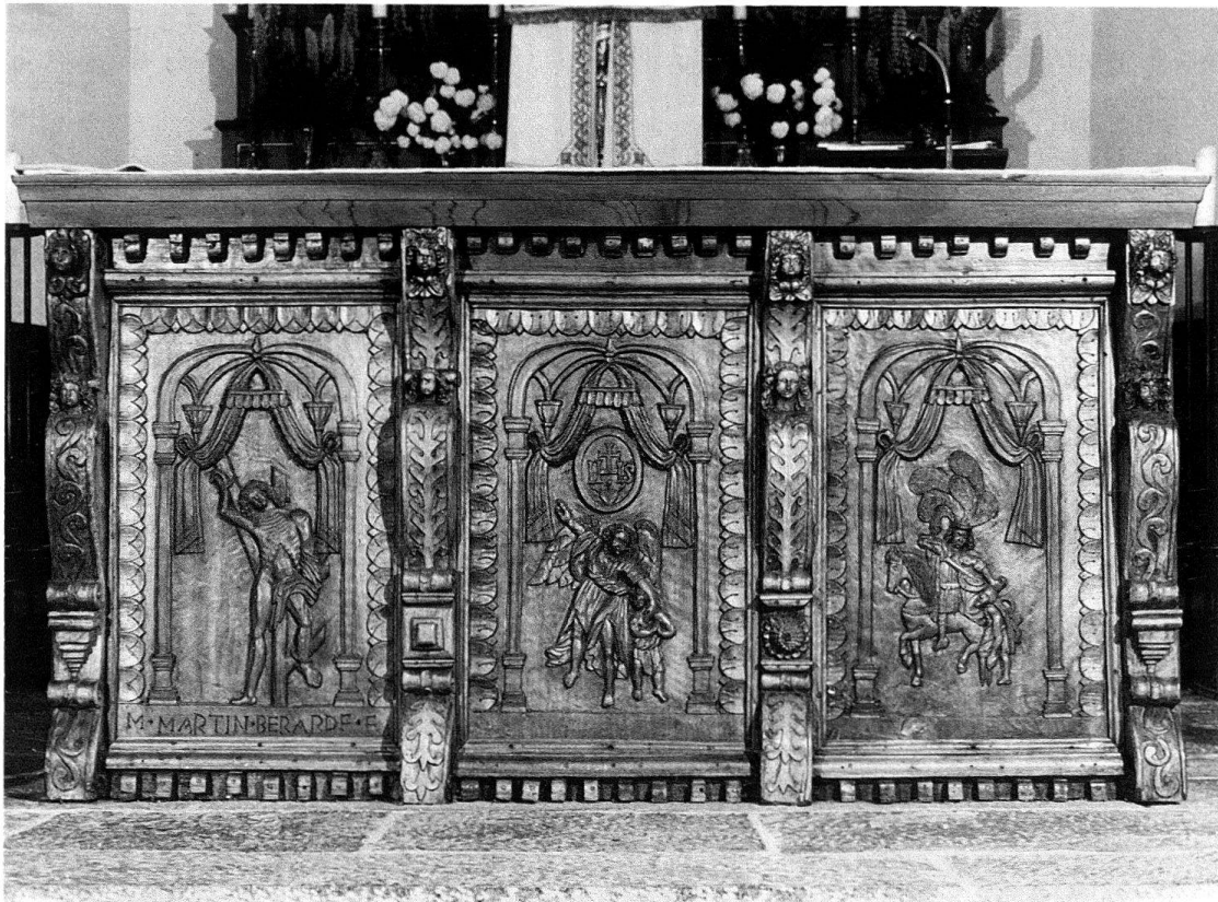
Fig. 3. Vollèges, église paroissiale, devant de l'autel de célébration, panneaux et montants de l'ancienne chaire, offerte par Martin Bérard en 1683