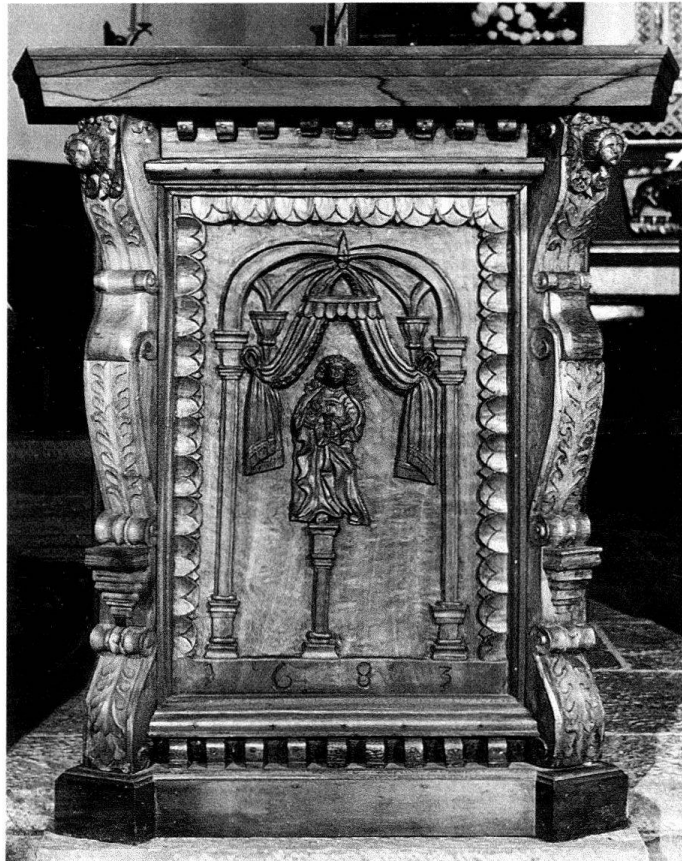
Fig. 2. Vollèges, église paroissiale, ambon constitué d'un panneau et de deux montants de l'ancienne chaire, 1683

on s'entendre sur les quelques pièces qui témoignent non seulement du goût et du savoir-faire de ceux qui les ont réalisées, mais aussi de la foi de ceux qui les ont commandées? Car il s'agit de documents qui attestent la continuité chrétienne dans la diversité de ses formes d'expression, c'est-à-dire de documents utiles à l'histoire de la religion autant qu'à l'histoire de l'art!