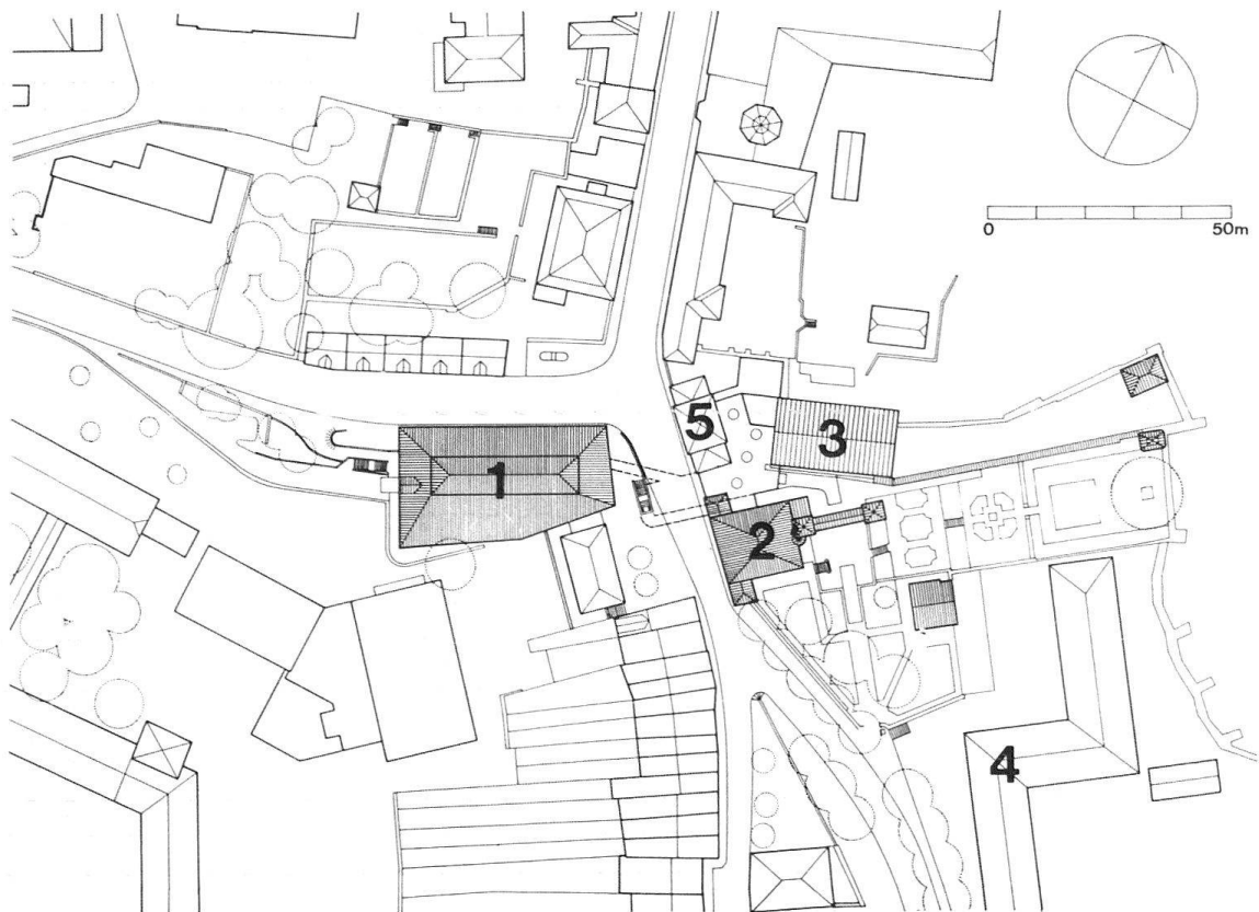
Abb. 1. Freiburg. Lageplan der Museumsbauten und deren Umgebung 1 Ehemaliger städtischer Schlachthof 2 Ratzéhof 3 Museumsanbau 1964 4 Franziskanerkloster 5 Ehemaliges Zeughaus

Der 1981 erweiterte Gebäudekomplex des Museums für Kunst und Geschichte in Freiburg schliesst im Südosten an den historischen Altstadt kern an (Abb. 1). Er setzt sich aus drei Bauten zusammen, die sich der im späten 13. Jh. erweiterten Stadtmauer harmonisch anfügen: dem 1583 im Stil der französischen Renaissance erbauten Ratzéhof, welcher heute die 1823 gegründete Sammlung mittelalterlicher und spätmittelalterlicher Holzplastik und Malerei beherbergt; dem 1964 erstellten Anbau für Wechselausstellungen und Verwaltung und dem ehemaligen, 1981 integrierten städtischen Schlachthof. Diese Bauten liegen heute zwischen dem Franziskanerkloster und dem ehemaligen Zeughaus. Bereits 1959 wurde die Museumskommission über die geplante und 1972 vollzogene Verlegung des städtischen Schlachthofs aufmerksam gemacht. Für das Museum bedeutete dies eine einmalige Chance zur Erweiterung der Ausstellungsfläche. Es galt nun, bei den öffentlichen Instanzen und bei Privaten das Interesse