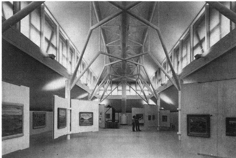
Abb. 4. Freiburg. Ausstellung «Hodler und Freiburg» im Dachgeschoss des umgestalteten Schlachthofes

des ersten Geschosses durch vier rechteckige Dreierfenstergruppen rhythmisch durchgestaltet; an beiden Seiten wird er von einem einzelnen Fenster abgeschlossen.