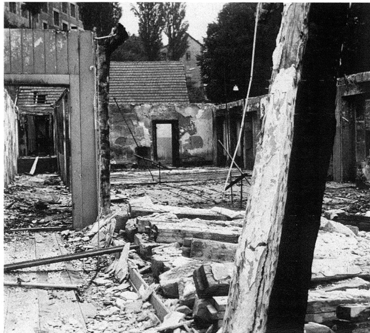
Abb. 2. Freiburg, Schlachthof nach dem Brand vom 12. Dezember 1975

an diesem Schlachthof zu wecken und dessen Zweckentfremdung zu begründen. 1972 bestimmte die Gemeinde, das Gebäude dem Museum für Kunst und Geschichte zuzuwenden; gleichzeitig wurde es auch unter Denkmalschutz gestellt. Die Museumskommission befasste sich darauf mit der Errichtung einer Stiftung zur Restaurierung und Finanzierung dieses Projekts. 1973 unternahm eine Gruppe amerikanischer Studenten der Ohio State University (Columbus), unter der Leitung der Professoren Perry E. Borchers und Pierre Zoelly eine grundlegende Studie mit Planaufnahme dieses Objekts, und 1974 erfolgte die Unterbreitung eines ersten Vorprojektes durch die Architekten Pierre Zoelly und Michel Waeber aus Zürich. Am 12. Dezember 1975 fiel der Bau einem Brand zum Opfer, der diesen bis auf die Umfassungsmauern vollständig vernichtete. Nun galt es, die Ruine des ehemaligen Schlachthofs vor der vollständigen Zerstörung zu retten und den Platz dieses Gebäudes innerhalb des ihn umgebenden historischen Stadtkerns zu rechtfertigen und zu verteidigen (Abb. 2). Gemeinde und Staat sprachen sich 1977 für eine gemeinsame Hauptfinanzierung, unterstützt durch private Geldgeber aus. 1980 wurden die ersten Arbeiten unternommen und am 11. Juni 1981 konnte nach 19 Monaten Bauarbeit der Schlachthof als Bestandteil des Museums für Kunst und Geschichte dem Besucher eröffnet werden.