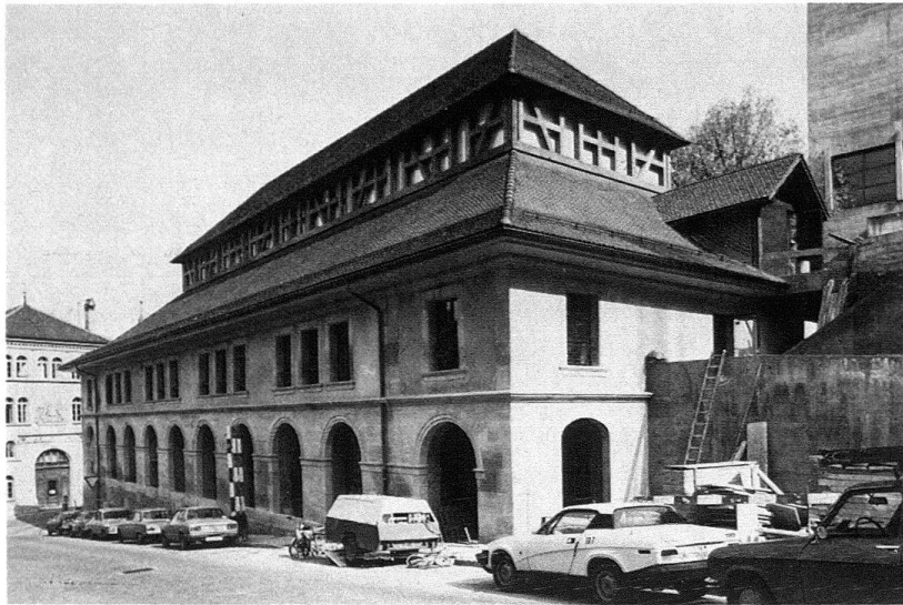
Abb. 3. Freiburg. Nordfassade des von Aloys Mooser erstellten Schlachthofes, 1834–1838, Zustand nach dem Um- bau von 1980–1981