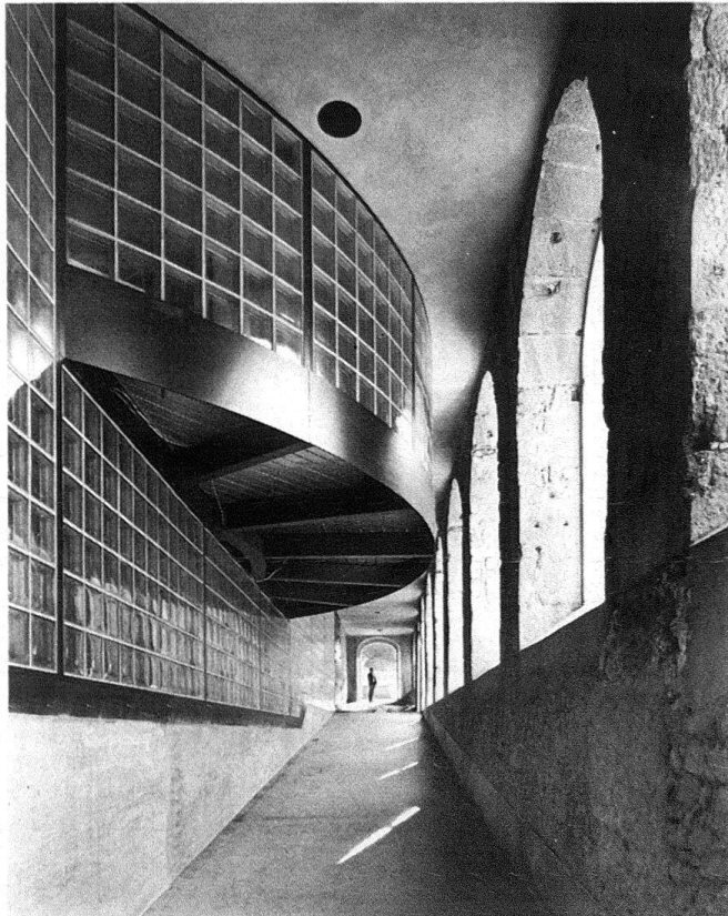
Abb. 7. Aussenansicht der Glasziegelwand mit überhängender Apsis

Das ehemals mit einem imposanten Eichengebälk versehene und später ausgebrannte Dachgeschoss wurde durch eine elegante, leichte Stahlstruktur ersetzt. An zehn Stahlpfeilern können Stellwände nach Bedarf eingehängt werden (Abb. 7). Das durch die Lichtgaden der Attikazone eindringende Licht erzeugt eine ideale Ausstellungsbeleuchtung. Bis anhin diente dieser Saal grossen Wechselausstellungen – so insbesondere 1981 «Hodler und Freiburg» und 1982 «Das graphische Werk von Henri Matisse», wird jedoch ab Frühling 1983 die museumseigene Sammlung moderner und zeitgenössischer Kunst einstweilen aufnehmen.