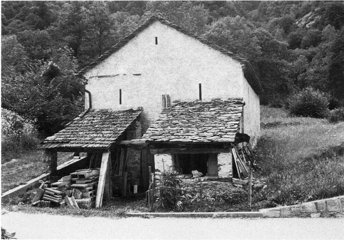
Abb. 3. Heustall bei Dongio. Zwei Anbauten aus verschiedener Zeit, und doch ertragen sie einander wegen ihrer strukturellen Verwandtschaft

ten Nassräumen riecht es muffig. Schlecht lüftbar, werden sie mit ihren kalten, womöglich auch vom Erdboden her feuchten Mauern nie trocken.