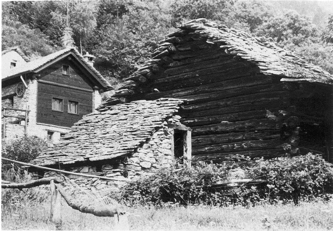
Abb. 2. Stall und Ferienhaus in Navone, oberhalb Semione. Zwangloser Steinanbau an einen Holzstall im Vordergrund, und verkrampft korrektes Ferienhaus im Hintergrund

bei der Arbeit Detaillösungen zu überlegen, die ihn nicht nur ökonomisch, sondern auch ästhetisch befriedigten.