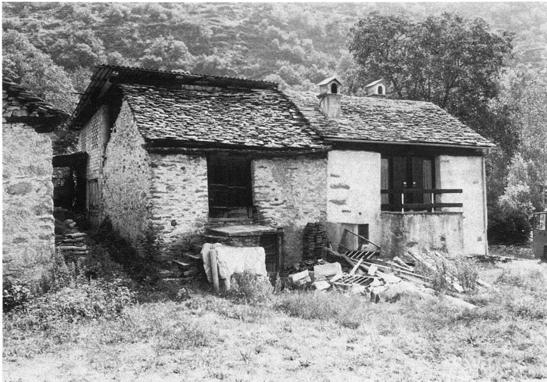
Abb. 6. Heustall und ehemaliger Heustall bei Malvaglia

nung in der Mitte des Giebels. Der Balkon ist gerade breit genug, dass er noch zum Sitzen im Freien einlädt. Die Massnahmen halten sich an vorgefundene Regeln und Typologien, auch wenn das Ganze anders konstruiert ist und anders aussieht als bei einem alten Tessiner Haus. Durch seine einfache Art, mit den geringen Eingriffen, fällt das Gebäude nicht aus der Häusergruppe heraus. Da kann das Dach flacher sein, ein anderes nebendran ist es auch. Es kann mit Eternit gedeckt sein, ein drittes daneben hat Ziegel auf dem Dach. Da nicht alles mit einer neuen Tünche, die alt aussuchen soll, überzogen ist, sind die Veränderungen ablesbar. Der Verputz besteht aus alten und neugemachten Flächen. Wesentlich ist, dass die Maurer bei ihren Flickarbeiten den Verputz locker mit der Kellenkante nachgezogen haben, so dass die Oberfläche gleichmässig rau wurde. Dieselbe Art des Verputzens wandten die Bauern schon immer an. Es sind keine Muster mit der Kelle eingedrückt, die den Verputz «rustikal» wirken lassen. Die wenigen Eingriffe und die unverändert belassenen Teile lassen das Haus so gewöhnlich erscheinen wie es eben ist. Es ist ein beliebiges Haus, kein besonderes.