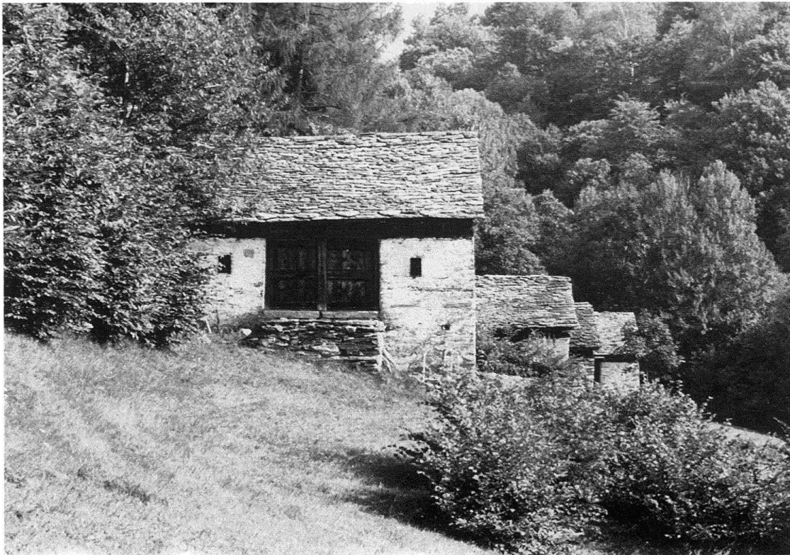
Abb. 1. Heuställe oberhalb Navone. «Und alles atmet schönheit und ruhe...»

Auch hier bringt die Umnutzung mehr Abgrenzung und verschlossene Tore. Heute wird dieser wichtige Bereich leider oft zum Autoabstellplatz abgewertet. Mehrdeutigkeit verkümmert zu armseliger Eindeutigkeit.