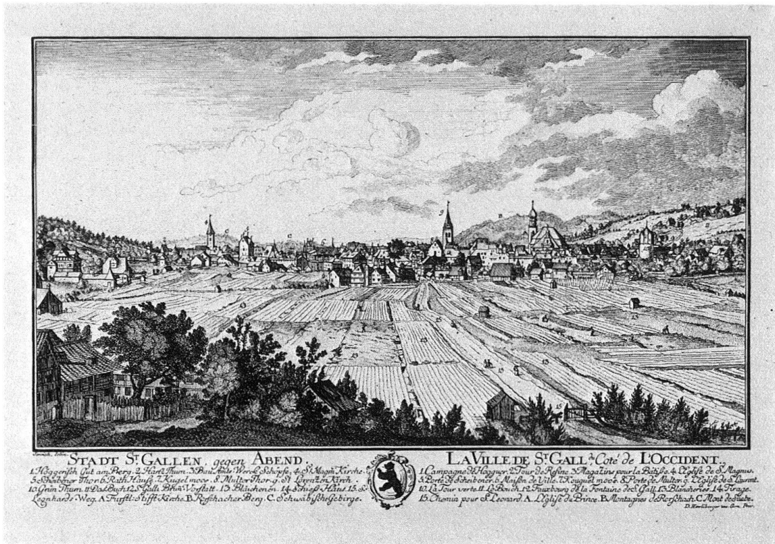
St. Gallen von Westen nach David Herrliberger, 1761