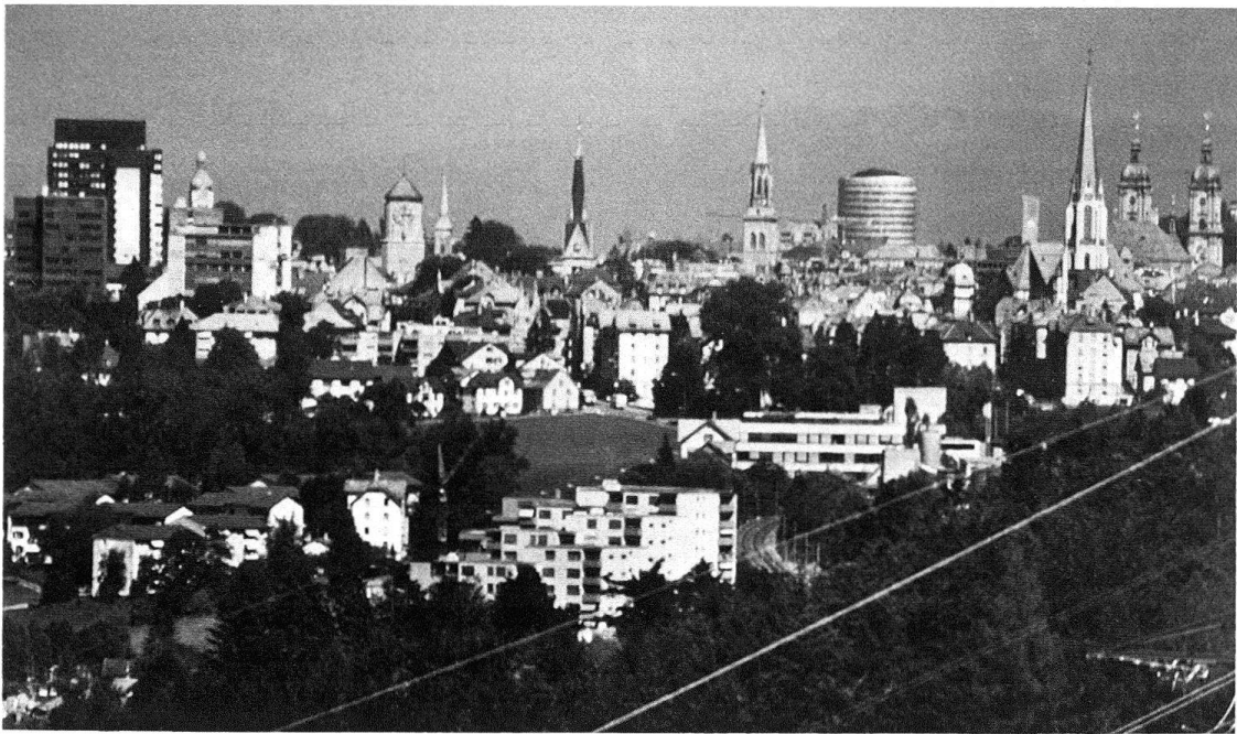
St. Gallen von Westen 1982 – die alten und die neuen Türme...