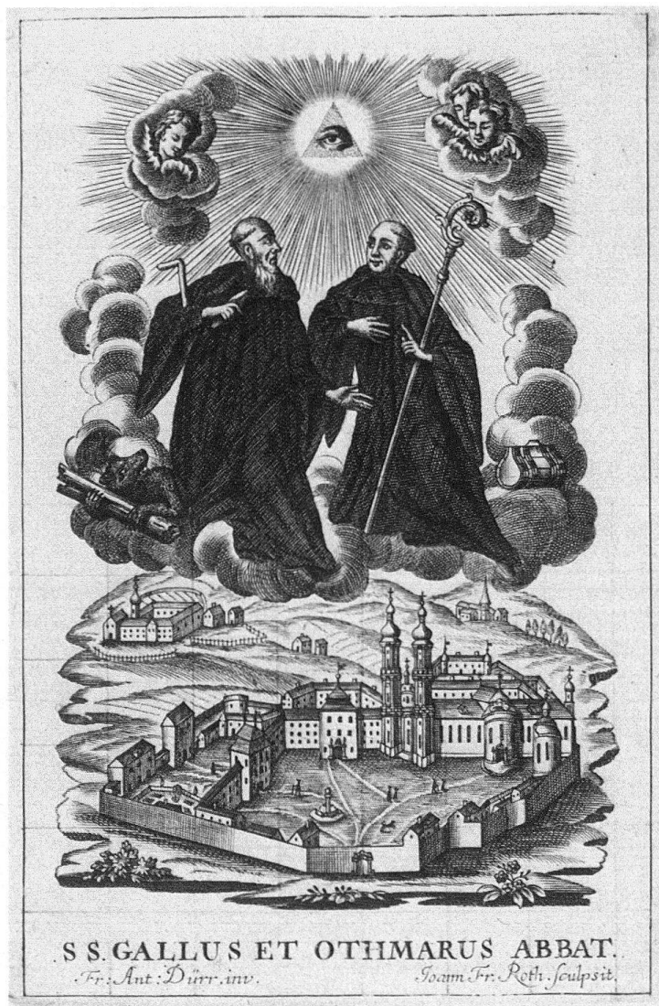
Abb. 3. Die heiligen Gallus und Otmar als Patrone des Klosters St. Gallen. Kupferstich von Roth und Dirr in Veränderung der gleichartigen Darstellung auf dem Handwerkerbrief (vgl. Abb. 2)

was am 11. August 1764 den Unwillen des Rates der Stadtrepublik St. Gallen erregt hatte 12 .