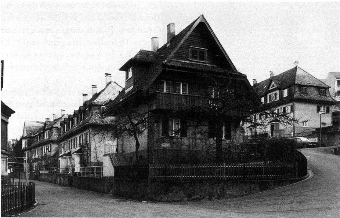
Abb. 4. St. Gallen, Schorensiedlung. Sonnenberg- und Fichtestrasse

Gerber folgte mit dem Entwurf dieses (und des zweiten) Bestraßungs- und Bauungsplans der zeitgenössischen Vorliebe für die krumme Strasse 19 . Für ihn spielten offenbar die Sitte'schen Gesichtspunkte, die Berücksichtigung der Geländesituation, die Schaffung wechselnder Strassenbilder durch Vor- und Rückspringen der Baufluchtlinien, die klare Gliederung der Baukörper, die Raumgestaltung, eine wichtige Rolle 20 .