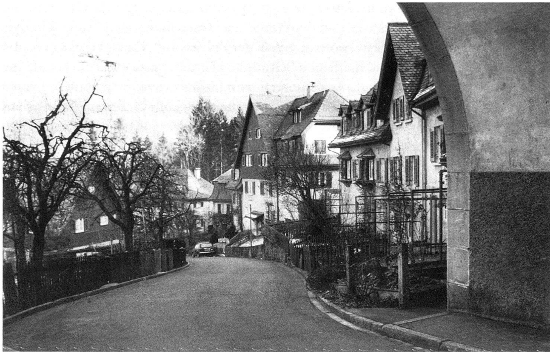
Abb. 3. St. Gallen, Schorensiedlung. Blick in die Lenau-Strasse

lernt 17 . Später sollte er als Entwerfer für die Eisenbahnersiedlung in Olten engagiert werden. Die St. Galler Eisenbahner-Baugenossenschaft unterbreitete am 23. Dezember 1909 dem Gemeinderat Straubenzell «ein Gesuch mit 28 Beilagen, von dessen Genehmigung es abhängt, ob sich die Hoffnung von Hunderten, zum Teil in ihrer wichtigsten Lebensbedingung, dem menschenwürdigen Wohnen, zurückgesetzter Bürger erfüllen sollen oder nicht» 18 . Einleitend appellierten die Gesuchsteller in einem weit ausholenden Exkurs an das Heimatgefühl, massen ihrer Lösung nationale Tragweite bei, versprachen sich eine «Veredelung und Vertiefung des Familienlebens» und verwiesen auf die funktionierenden Kolonien der Port Sunlight Werke bei Liverpool, der Kruppischen Werke in Essen und der Firma Gminder in Reutlingen. Ob in der Auswahl der zitierten Beispiele – sie stellen alle paternalistische Lösungsversuche von Fabriksiedlungen dar – wohl Absicht steckte? Jedenfalls zogen die Bähnler alle möglichen Register, um den Gemeinderat von ihrem Projekt zu überzeugen.