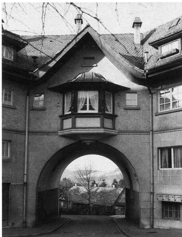
Abb. 6. St. Gallen, Schorensiedlung. Torbogen am ehemaligen Geschäftshaus

nahm, wurde der St. Galler Firma Friedrich Buzzi und Sohn übergeben. Es betraf die Bauten an der Sonnenberg-, Lenau-, Schoren- und der östlichen Fichtestrasse.