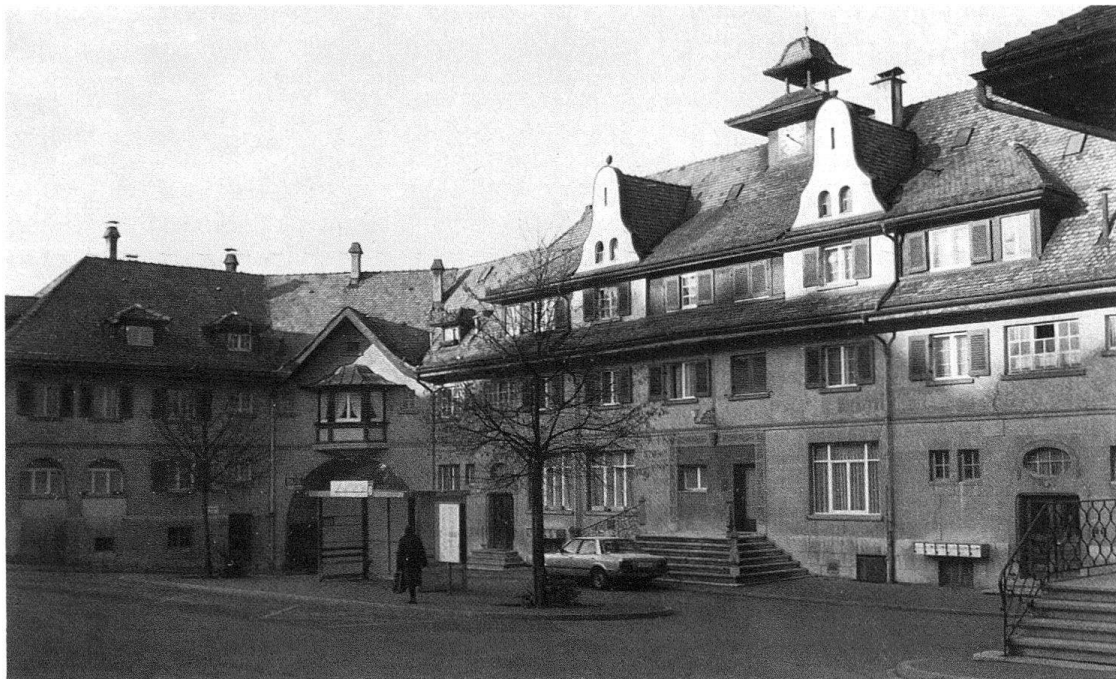
Abb. 2. St. Gallen, Schorensiedlung. Ehemaliges Geschäftshaus mit Consumladen, Bäckerei und Kinderhort. Die Geschäftslokalitäten wurden inzwischen zu Wohnungen umgestaltet

preise hat die private Bautätigkeit zurückhaltend gemacht und zum Teil ganz lahm gelegt. Schon seit Jahren hat dieselbe mit dem Zuwachs der Bevölkerung nicht mehr Schritt gehalten. Man baute übrigens in der Hauptsache immer nur für Leute mit einem Einkommen von 4000 Franken an.