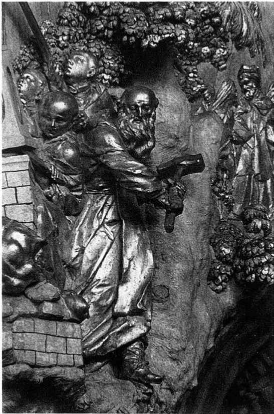
Abb. 1. St. Gallen, Kathedrale. Abbruch als Fortschritt und Teil unserer Geschichte: Benedikt zerstört mit Hilfe seiner Mitbrüder die Apollo- und Dianastandbilder auf Monte Cassino. Relief im St. Galler Chorgestühl von Joseph Anton Feuchtmayer, um 1767 vollendet (Ausschnitt)