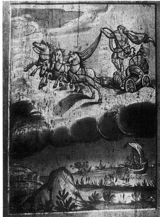
Freiburg. Rue des Alpes 54. Ausschnitt aus einem Fries mit Blütenranken, um 1630. – Rue Pierre Aebly 208. Decke mit Darstellungen aus Ovids «Metamorphosen» (Phaëton), Ende 17. Jh.

ter Teil davon blieb uns glücklicherweise erhalten. Ich hatte ursprünglich den Plan, die Dekorationen im Gebiet des ganzen Kantons Freiburg zu erfassen. Da sich aber schon die Stadt allein als erstaunlich reich herausstellte, beschränkte ich mich auf ihr Gebiet, fügte dann allerdings noch die Vogteischlösser und einige besonders interessante Sommersitze der Landschaft hinzu.