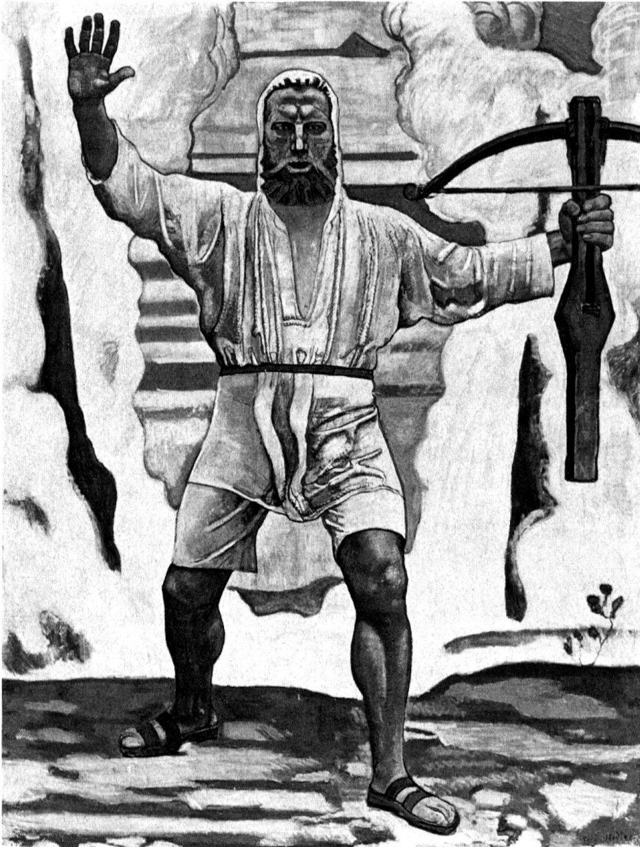
1 Ferdinand Hodler, Wilhelm Tell, 1897. Öl auf Leinwand (Kunstmuseum Solothurn).

Und auch Hodlers Landschaften stimmten aufs genaueste mit den entsprechenden Schweizer Landschaften überein, mehr noch, so wie «die Franzosen» ihre ganz besondere Ambiance vermittelten, so erfasste Hodler wie kein anderer ein Klima, das es nur in der Schweiz gab, hatte die Stimmung, wie sie besonders in diesen ersten Nachkriegsjahren herrschte, vorweggenommen. Seither hat sich gottlob doch vieles geändert.