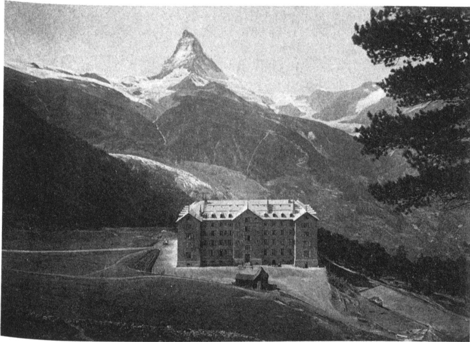
1 Vom Hotel Riffelalp aus sahen vornehme Touristen das Matterhorn und verglichen es mit einer Skulptur.

des grossen Schwierigkeitsalpinismus, die Nordwand dieses form-schönen Viertausenders viele Extreme an. Nicht nur die Steilheit, auch die Linie war herausfordernd.» Messner zählt die Matterhorn-Nordwand zu den «grossen Wänden», zusammen mit anderen finsternen Berühmtheiten, der Eiger-Nordwand oder der Dhaulagiri-Südwand zum Beispiel 4 .