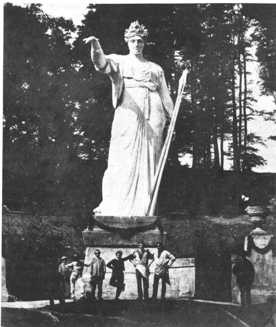
5 Eugène Grasset, Helvétie, photographie de A. Schmid lors du Tir Fédéral de Lausanne en 1876 (Musée de l'Elysée, Lausanne).