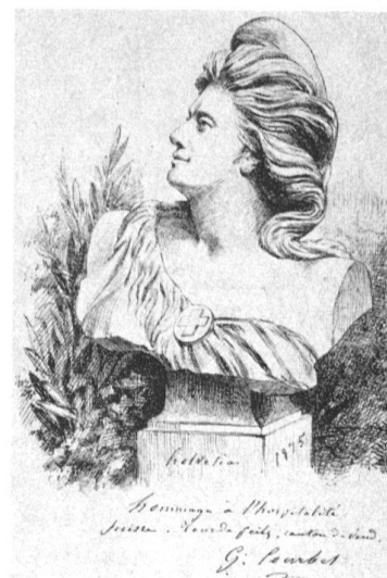
6 Gustave Courbet, Helvetia, lithographie 345×253 cm (Musée cantonal des beaux-arts, Lausanne).