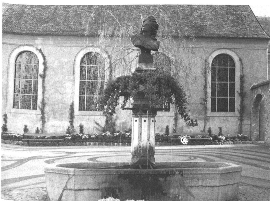
1 Gustave Courbet, Helvetia, plâtre, hauteur 100 cm (La Tour-de-Peilz, Maison de Commune).