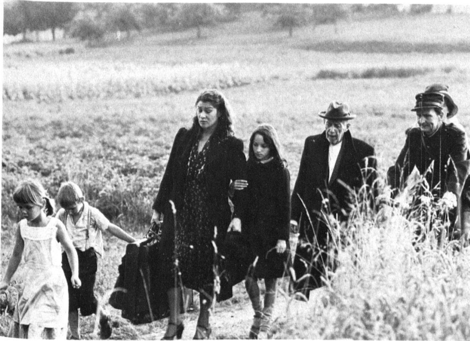
3 Szenenfoto aus Markus Imhoofs Film «Das Boot ist voll», 1980.

schen Selbstverständnisses von Humanität und Solidarität befehlen. Die Schweiz erscheint da, als sie nach langem Marsch über die Berge endlich ins Blickfeld der Flüchtlinge gerät, durchaus böserweise als ein Land, das sich hinter einem Drahtverhau von Reglementierungen verschanzt hat. Durchaus also wird auch in diesem Film, der in der Zeit seiner Entstehung keineswegs das Wohlwollen der zivilen und militärischen Behörden genoss, die Zweideutigkeit der politisch-moralischen Position unseres Landes aufgezeigt – wenn gewiss eher nur skizziert als wirklich ausgeführt.