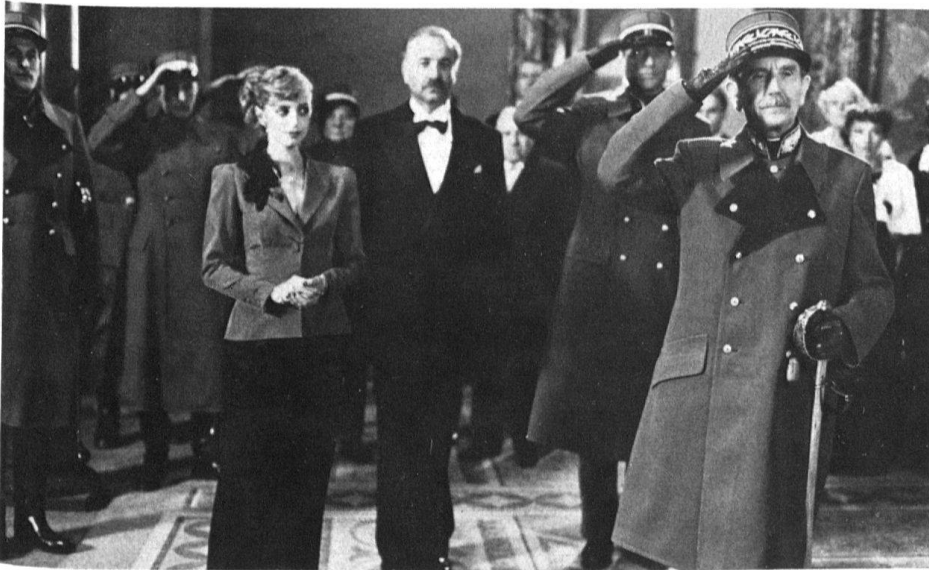
1 Szenenfoto aus Thomas Koerfers Film «Glut», 1983.