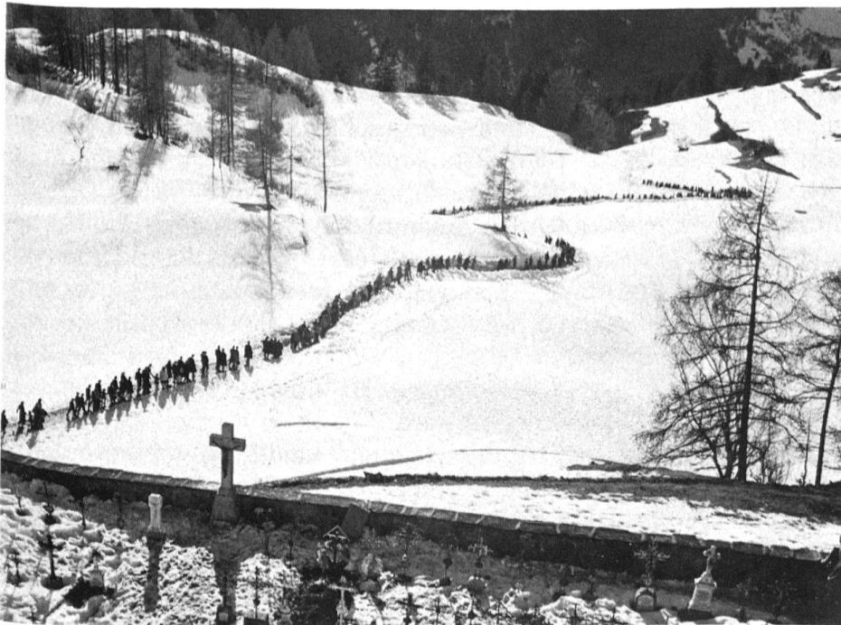
2 Szenenfoto aus Leopold Lindtbergs Film «Die letzte Chance», 1945.