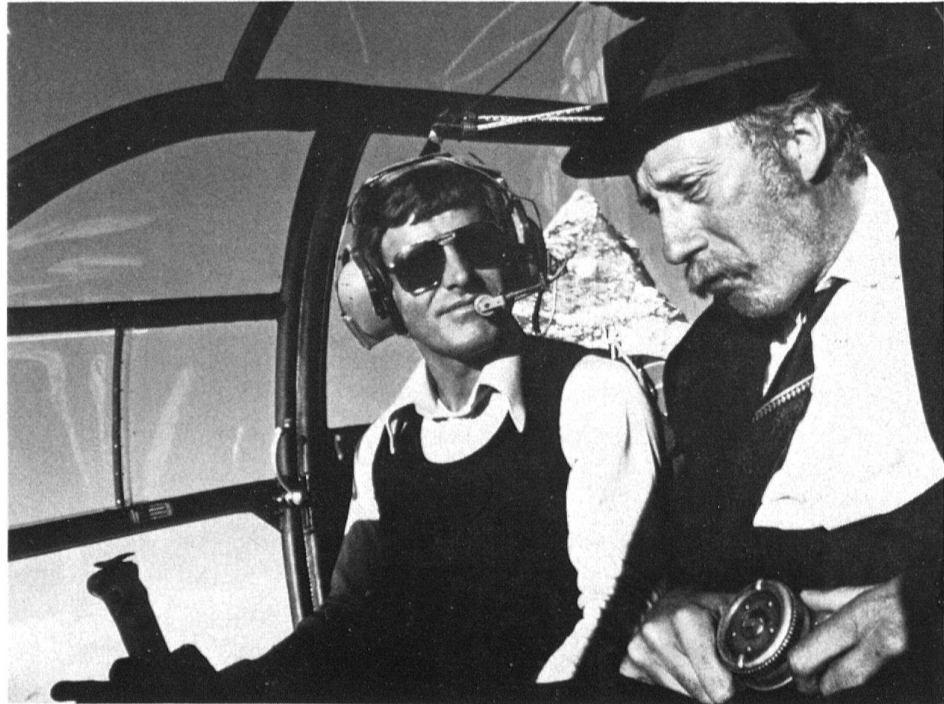
6 Szenenfoto aus Yves Yersins Film «Les petites fugues», 1979.

neuen Augen (und mit Hilfe einer Photokamera) seine engste Umgebung endlich wahrnimmt. Und Kurt Gloor lässt in «Die plötzliche Einsamkeit des Konrad Steiner» (1976) den verwitweten alten Schuhmacher, der sich weigert, seine Wohnung zu verlassen, ausschweifen in die Utopie, auf eine Reise, die vielleicht zum Ziel, in die Freiheit von Zwängen, führt.