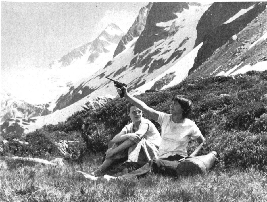
7 Szenenfoto aus Alain Tanners Film «Messidor», 1978.