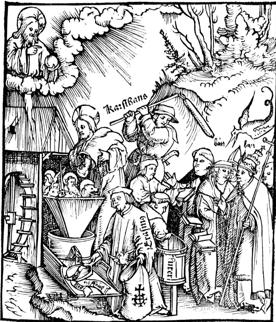
1 Hans Füessli, Martin Segel, Huldrych Zwingli: «Beschreibung der göttlichen müly...», Titelholzschnitt (145×126 mm). Zürich: Christoph Froschauer d. Ä., 1521. Zürich ZB (Zw. 106 a).

Syß hand zwen schwyzer puzen gmacht furwar sy hand es wol betracht.