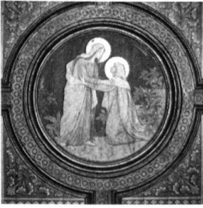
5 La visitation. Médail- lon du plafond de la nef de Planfayon peint en 1909.

passé par simple conformité au goût de l'époque. A des degrés divers, ils s'inscrivent tous, comme nous le verrons, dans le courant de l'éclectisme créatif 15 .