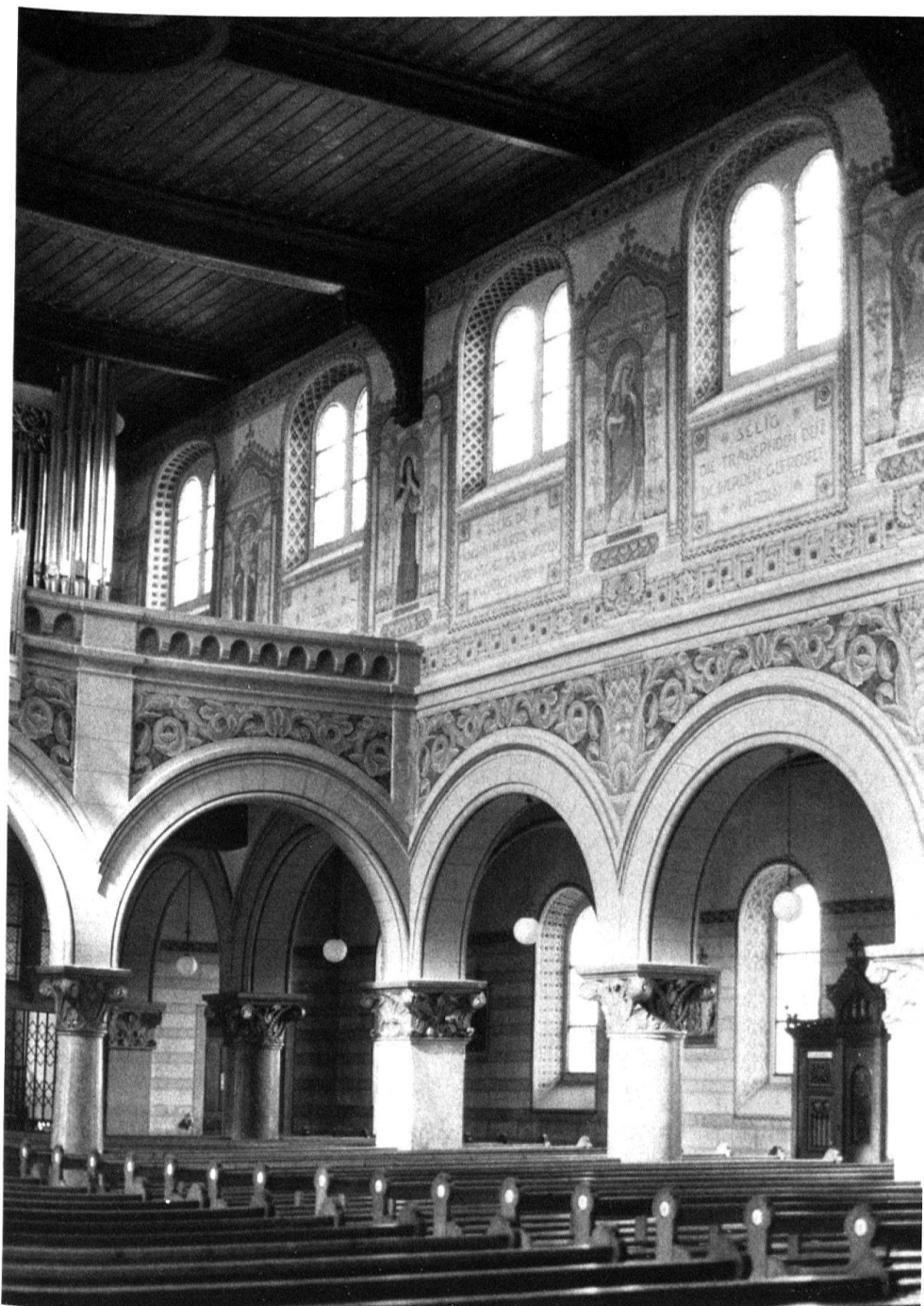
6 Nef et tribune de l'orgue de l'église de Planfayon. Les motifs floraux et les figures de saints relèvent de l'Art Nouveau.

gnent-ils d'une résurgence ou d'une réactualisation du sentiment romantique qui associait, à titre de comparaison, la cathédrale gothique à la forêt, analogie visuelle illustrée par exemple par Karl Friedrich Schinkel? 19 Du point de vue formel, ces motifs relèvent de l'Art Nouveau et de son goût pour «la plante et ses applications ornementales», formule empruntée au titre de l'ouvrage de Eugène Grasset, publié à Paris en 1896–1897. Inscrite dans une géométrie des lignes courbes, la nature y subit des métamorphoses décoratives, engendrées par la recherche d'un graphisme élaboré et une volonté de stylisation. A cet égard, les trois églises du district de la Singine, Planfayon, Heitenried et Schmitten (1896–1898) sont éloquentes. Des thèmes d'inspiration géométrique (les grecques en particulier) ou