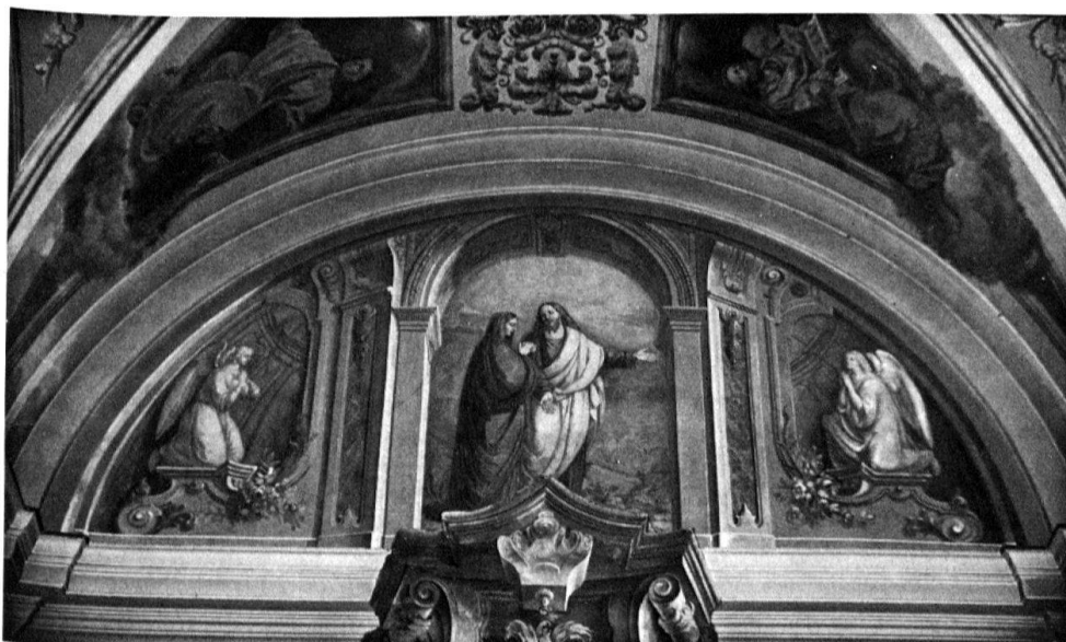
3 Intragna, S. Gottardo. Lunetta sulla parete di fondo, 1859.