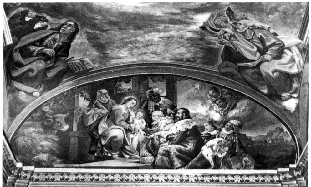
7 Contra, S. Bernardo. Lunetta sulla parete di fondo: Adorazione dei Magi. G. A. Vanoni, 1863.