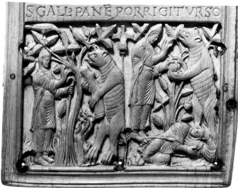
1 St. Gallen, Stiftsbibliothek, Codex 53, Elfenbeinrelief des Hinterdeckels.

herrschenden Künstler vorstellte und der dazu noch angenehm im Umgang, eben «im Ernst und im Scherz unterhaltlich» zu sein hat – «serio et ioco festivo». Dass seine Hand von göttlicher Inspiration geleitet war, wie dies Ekkehard im 45. Kapitel der Casus berichtet 13 , gehört zu den literarischen Topoi , vermag uns aber das in Worten schwer fassbare Besondere des Frontispizbildes im Goldenen Psalter erklären helfen: