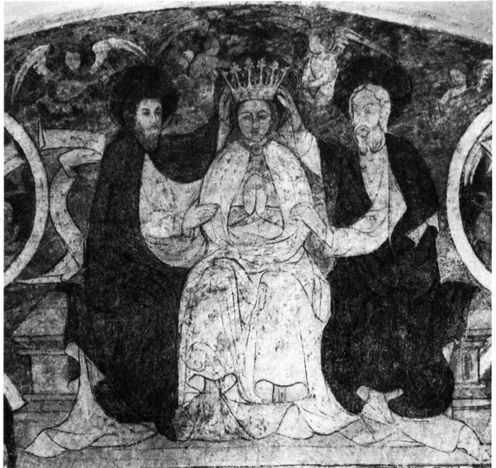
2 Waltensburg, église. Détail du couronnement de la Vierge.

Reste enfin le problème de l'origine de l'artiste, question qui pourrait également contribuer à expliquer le choix iconographique. Mais il est impossible de trancher. Région de transit, les Grisons ont été exposés aux influences les plus diverses. Pour Raimann 20 , au XIV e siècle – et certainement encore au XV e – ces influences viennent tantôt du Nord, tantôt du Sud et de l'Est, mais sporadiquement de l'Ouest et donc de France. En ce qui concerne la technique et le style de l'artiste, Poeschel 21 relève le phénomène du Flächenstil ainsi que le peu de couleur locale et le trait sûr et linéaire. Il situe par conséquent le peintre dans l'aire artistique allemande 22 ; tandis que Ganz 23 , qualifiant la facture comme «spröd-linear», postule en faveur d'un travail indigène.