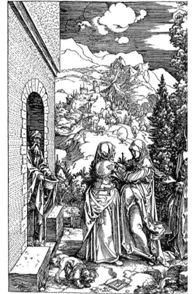
15 DIE HEIMSUCHUNG, MARIENLEBEN 8, H. B 84 UM 1503/04

Durch das Vorlagenwesen leben oft untergegangene Kunstwerke ganz oder teilweise in anderen weiter. Ein seltsames Schicksal hatte der um 1517–1519 von Hans Holbein dem Jüngern geschaffene Flügelaltar, ein Nebenaltar, in der Luzerner Franziskanerkirche. Charles Patin bietet 1676 in seinem Œuvrekatalog des Meisters eine Liste von fünf Darstellungen dieses Altars: Anbetung des Jesuskinde durch Maria und Josef, Anbetung durch die Heiligen Drei Könige, Anbetung des vom Kreuz abgenommenen Erlösers, das Schweisstuch der Veronika von Engeln gehalten, Christus im Tempel auf der Kathedra die Juden lehrend. Von all dem war zu Beginn des 19. Jahrhunderts nur noch der Flügel mit der Beweinung unter dem Kreuz vorhanden. Er wurde dem Kloster durch eine List entfremdet, indem betrügerische Händler diesem 1813 eine Kopie anstatt des Originals zurückgaben, das seither verschollen ist. Ein Fall, der zeigt, wie eine gute Kopie funktionell als «Fälschung» verwendet werden kann. Es war aber nicht die erste Kopie dieses Bildes. Schon