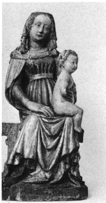
3 Serienwerk von hohem Rang: Thronende Muttergottes, erstes Viertel 15. Jahrhundert, aus Weggis LU, heute im Schweizerischen Landesmuseum Zürich, Inv.-Nr. 20088.

schen Architekturkopie. Ihr berühmtestes Beispiel ist die Heiliggrabrotunde in Jerusalem mit ihren zahllosen symbolischen Ablegern vom Frühmittelalter bis in den Barock. In Jerusalem war das Pilgerziel rein architektonisch, bestehend aus dem Erlösergrabmal und dem Rundbau darüber. In Einsiedeln haben wir zwei Kultobjekte: erstens die Gnadenkapelle als Nachfolgerin der Zelle des hier im Finstern Wald 861 erschlagenen heiligen Meinrad – in der romanischen, gotischen und barocken Kirche als «Ursache» des ganzen Heiligtums geborgen, immer wieder erneuert – und zweitens das hölzerne Gnadenbild der Muttergottes aus der Mitte des 15. Jahrhunderts, Nachfolgerin des 1465 beim Kirchenbrand zerstörten romanischen Kultbildes. Ähnlich wie im Falle von Altötting sind sowohl das Kultbild wie auch die Gnadenkapelle auswärts mehrfach durch massgetreue kultische Kopien geehrt worden. Das Luzernerland besitzt keine «Einsiedlerkapelle», wohl aber im Hergiswald eine Kopie der Casa Santa von Loreto, des nach der Legende im 13. Jahrhundert von Engeln aus Nazareth nach der Ostküste Italiens transportierten Hauses der Heiligen Familie. Während in Loreto die Casa unter der Kuppelvierung einer mächtigen Renaissancebasilika steht und mit reich skulptierten Marmorfassaden verkleidet ist, umhüllt im Hergiswald ein scheuenhafter, phantasievoll ausgestatteter Barockraum den kahlen Bau.