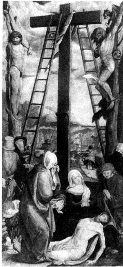
5 und 6 Kopie nach Hans Holbeins d. J. Altarflügel der Beweinung Christi von 1517–1519. Luzern, Pfarrhaus zu Franziskanern. – Kopie Renward Forers 1615–1620 nach Hans Holbeins d. J. Beweinung Christi von 1517–1519. Stadtkirche Baden.