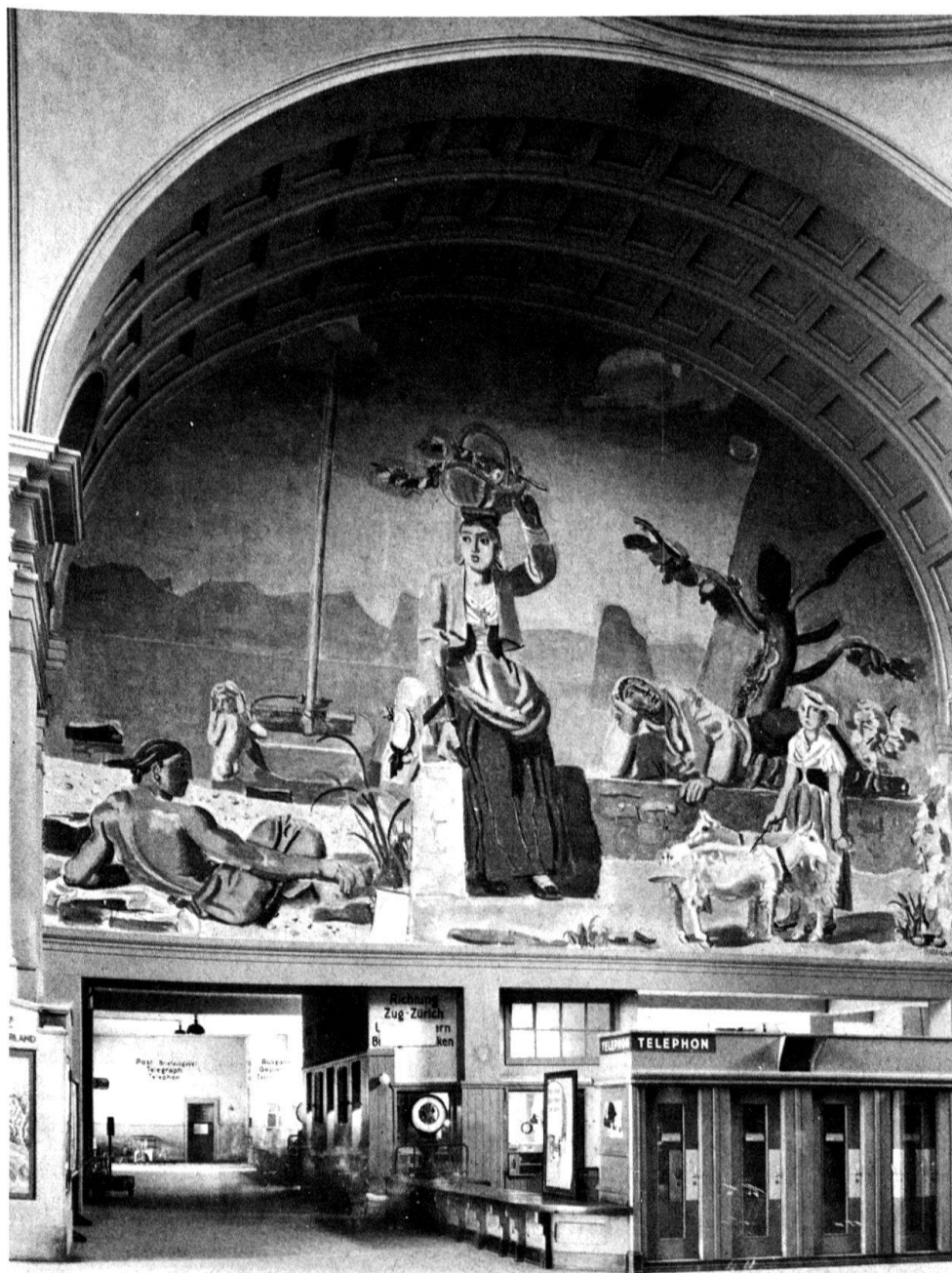
1 Maurice Barraud, «Nord-Süd», Wandbild im Bahnhof Luzern, 1929 (nach dem Brand abgelöst und bis zur Integration in den Bahnhofneubau eingelagert).

zern. Bei der Ausführung des Bahnhofbildes half ihm Charles Chinetti aus Rolle VD. Diesem Mitarbeiter Barrauds verdanken wir wertvolle Informationen über das maltechnische Vorgehen, von den Entwürfen bis zu den abschliessenden Arbeiten 1 . Für die Ausführung wählte Barraud die Keimsche Mineralfarbertechnik.