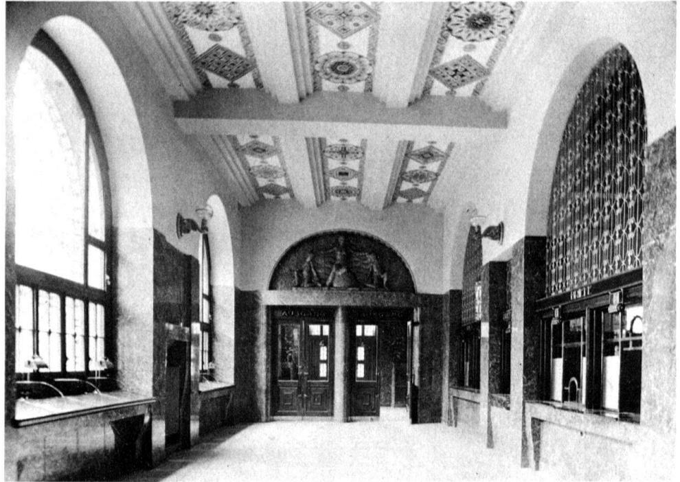
2 St. Gallen, Hauptpost (Schalterhalle), erbaut 1910–1914 von Otto Pfleghard und Max Haefeli, renoviert 1978.