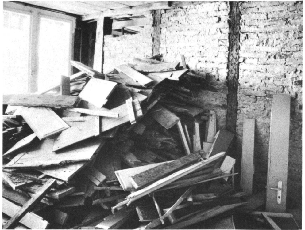
3 Herausgerissene Täfer in einem Wohnraum an der Rathausgasse.

von universeller Bedeutung zu sein, die Motivation verbessern, zum eigenen Haus Sorge zu tragen. Auch die öffentliche Meinung kann im Verlauf der Zeit das Tun und Lassen der Privaten beeinflussen.