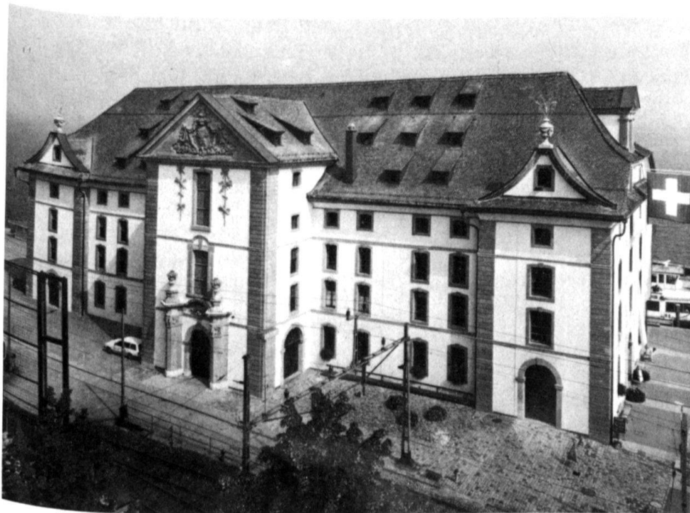
1 Bundesschutzobjekt Kornhaus Rorschach. 1745–47 von Bagnato erbaut. 1944 unter Bundesschutz gestellt. 1984–85 restauriert. Der Bund wahrte sein Mitspracherecht, verweigerte jedoch den Beitrag. In Rorschach ist man verärgert.

In der Praxis erlebt man zudem immer wieder, dass schon die kurze Zeitspanne eines Jahrzehnts genügt, eingegangene Verpflichtungen in Vergessenheit geraten zu lassen. In Gremien mit starker Rotation, genannt seien örtliche Kirchenvorsteherschaften, tritt dieser Fall häufig ein. Nach sanktgallischem Recht sind gemäss Artikel 101 des kantonalen Baugesetzes Schutzmassnahmen Sache des Gemeinderats. Folglich bietet nur die kommunale Schutzverordnung oder die Aufnahme des Objekts in das Verzeichnis der schützenswerten Bauten der Gemeinde einen zuverlässigen Schutz.