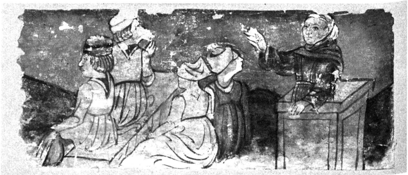
3 Bellinzona. Albergo del Cervo. Particolare del soffitto.

III.4 tano i suoi insegnamenti, dandoci un esempio di trasgressione della norma che, capovolto e letto nel giusto senso, diviene un'esortazione a seguire la morale del predicatore. Nella seconda tavoletta, tanto la posizione dei fedeli quanto quella del religioso subiscono un'inversione caricaturale. Al posto del predicatore troviamo una figura molto familiare al pubblico medievale: l'eroe principale del Roman de Renart , ovvero la volpe, nota nel mondo italiano con il nome di Rainaldo, e di fronte a lui un singolare pubblico di fedeli, formato da sei oche con il contapregchiere in bocca e una settima, già sedotta dal furbo monaco, raffigurata nel cappuccio di Rainaldo.