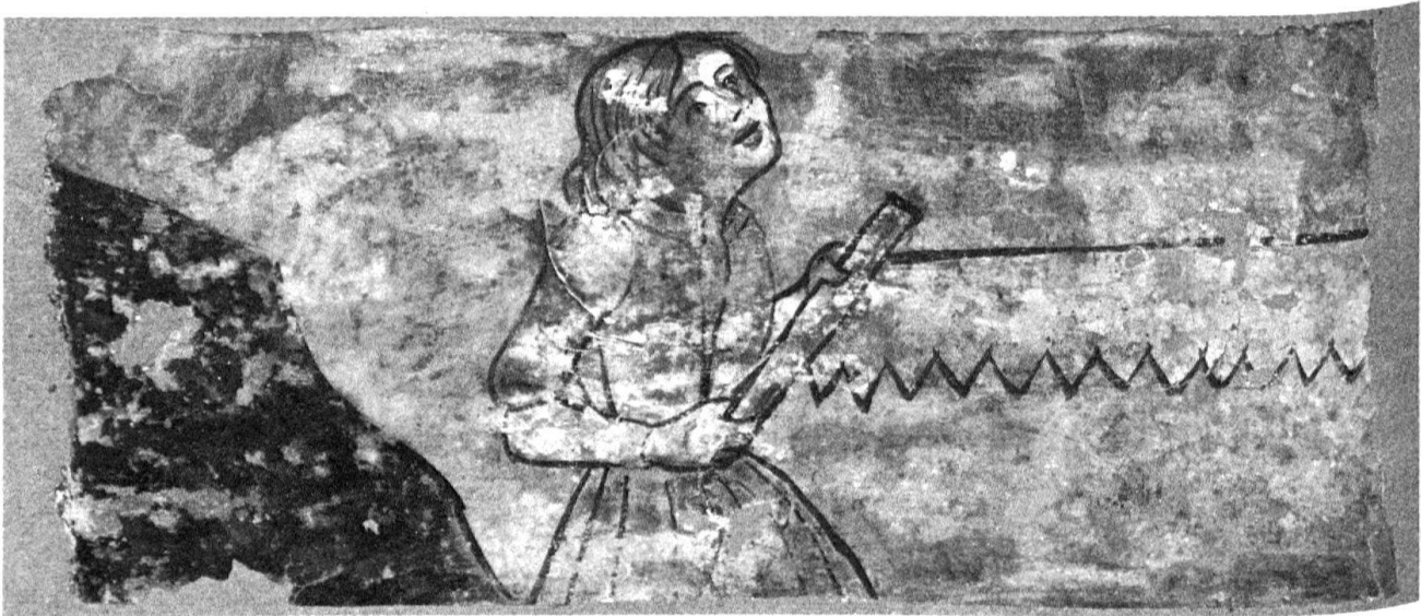
5 Bellinzona. Albergo del Cervo. Particolare del soffitto.

si differenziano da quelle viste in precedenza per il gioco scherzoso che instaurano con il soffitto: nelle prime vediamo infatti una ragazza da un lato e un giovane dall'altro che, azionando una lunga sega, mostrano di voler segare una trave del soffitto, situata al centro. La burla è semplice, ma possiede un suo significato morale comprensibile alla rovescia, ricordando la tematica matrimoniale della decorazione circostante. In realtà gli attori non sono boscaioli, come il soggetto vorrebbe, ma una giovane coppia di fronte alla vita, durante la quale dovrebbe cercare di costruire e non di distruggere. Nelle ultime due tavolette ritroviamo uno scherzo analogo: due giovani fingono di sostenere le travi del soffitto, uno con il dorso e l'altro con le braccia. In forma leggermente diversa anche questo motivo ritorna nelle stampe posteriori, dove vediamo ad esempio un uomo che sostiene la propria casa cadente con le sole braccia 19 .