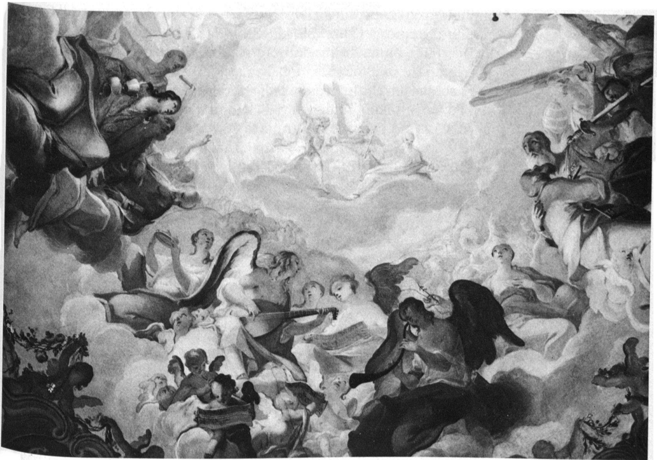
5 Arognò, chiesa di S. Stefano, volta del presbiterio, particolare.

essenziale tra due culture «essenzialmente simbiotiche come la lombardo veneta e l'austro germanica» 11 . La produzione artistica di questa schiera di pittori «minori» ha il merito di aver posto le premesse nella nostra regione per gli sviluppi successivi della pittura settecentesca. Infatti, in Italia penetrano indirettamente con questi artisti anche schemi altrimenti sconosciuti.