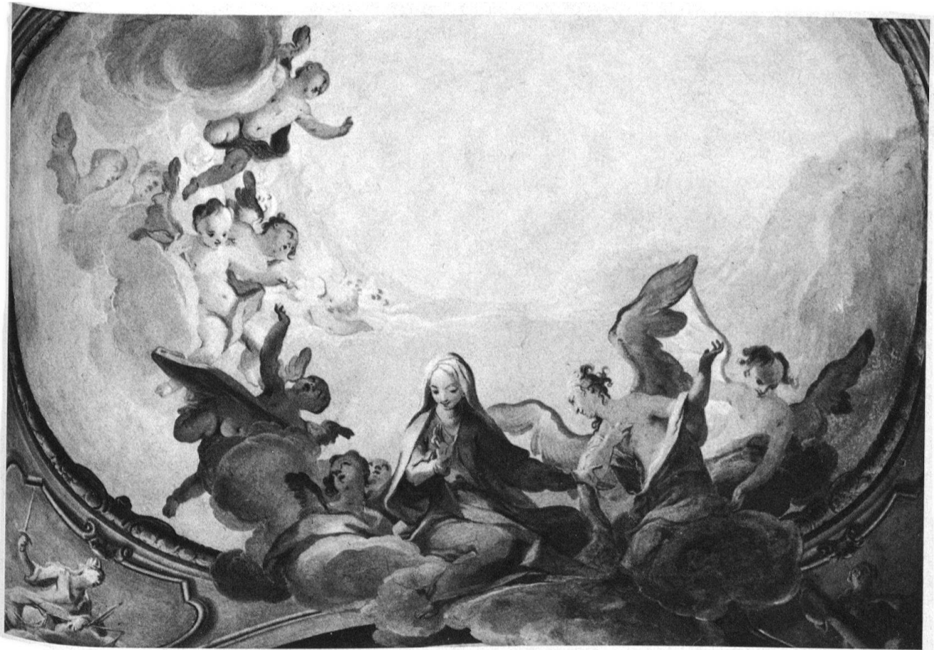
3 Arognò, chiesa di S. Stefano, cappella di S. Antonio da Padova, particolare della volta.

sche del Nord Europa e in particolar modo da quella svolta al servizio del duca Eberhard Ludwig, nel Baden-Wuerttemberg.