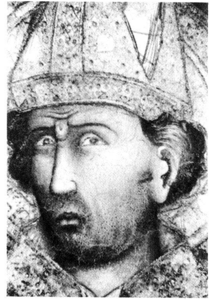
11 «Maestro di Fissiraga», Grabmal des Fissiraga, Lodi, S. Francesco.