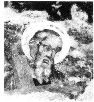
16 «Secondo Maestro di S. Biagio», St. Andreas, Ravecchia, S. Biagio.

Il «Maestro di San Biagio», autore degli affreschi sulla facciata e di due frammenti nella navata laterale di destra della chiesa di S. Biagio a Ravecchia, si distingue nel panorama dell'arte lombarda per straor-