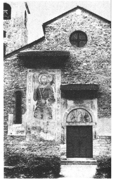
1 Ravecchia, S. Biagio, Fassade.