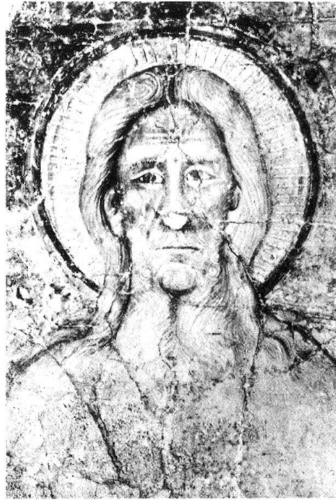
7 «Maestro di S. Biagio», Christus (Ausschnitt), Ravecchia, S. Biagio.