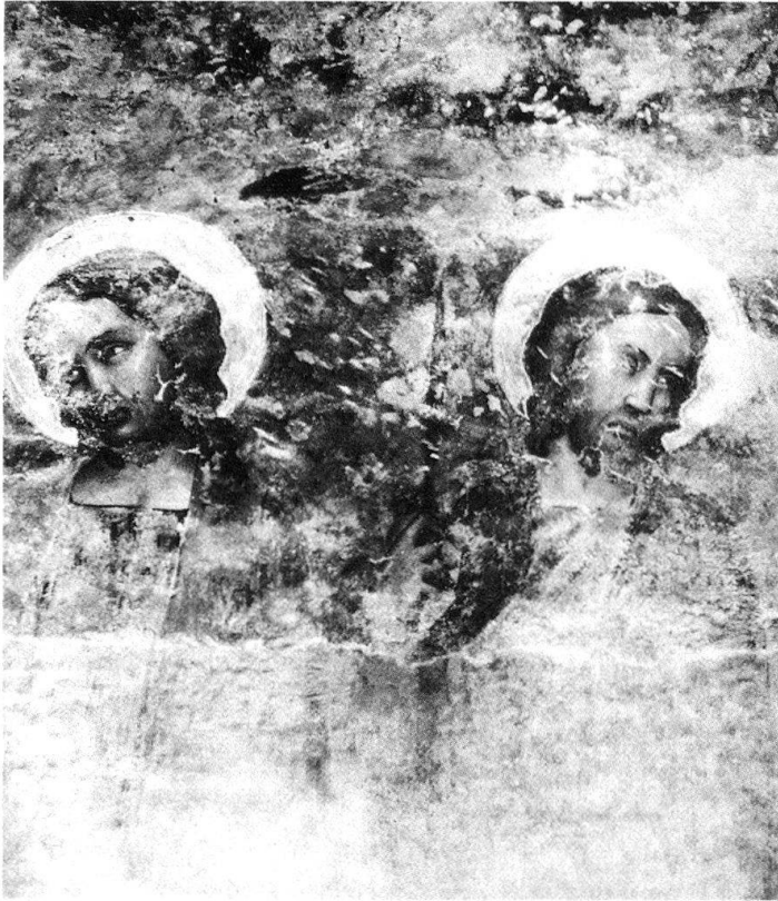
14 «Secondo Maestro di S. Biagio», St. Jakobus der Ältere und weiterer Apostel, Ravecchia, S. Biagio.