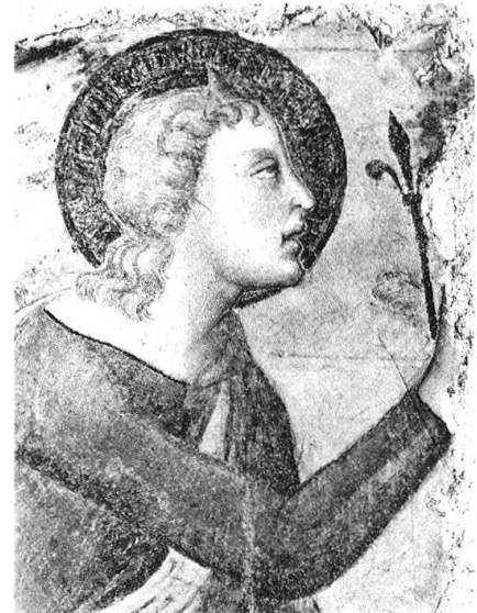
4 «Maestro di S. Biagio», Verkündigungsendel (Ausschnitt), Ravecchia, S. Biagio.