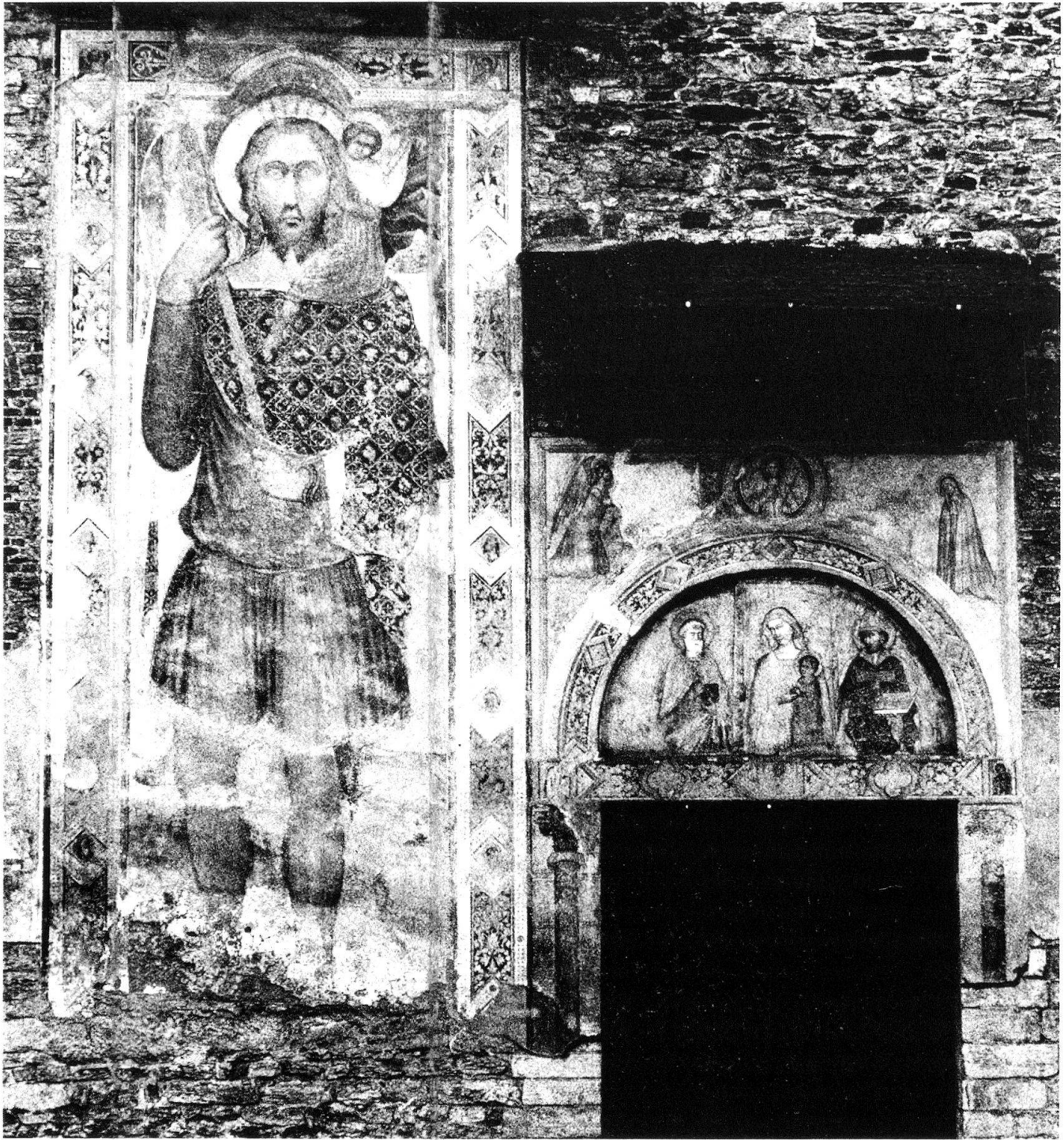
2 «Maestro di S. Biagio», Fassadenfresko, Ravecchia, S. Biagio.

zelne illuminierte Manuskripte 3 . Herausragende Künstlerpersönlichkeiten mit klarem Profil und richtungsweisende «Capi Scuola» wie in Florenz und Siena fehlen in der Lombardei des 14. Jahrhunderts fast gänzlich. Einzig mit dem Meister des Fissiraga-Grabmals in der Franziskanerkirche von Lodi und dem namentlich unbekanntem « Maestro di S. Abondio », die in der Gegend von Como, Varese und Mendrisio verschiedene Freskenzyklen hinterlassen haben, kann zumindest in der Gegend von Como im frühen Trecento eine stilistisch zusammenhängende Tradition festgestellt werden 4 ; doch von einer recht eigentlichen comaskischen Malerschule kann kaum die Rede sein.