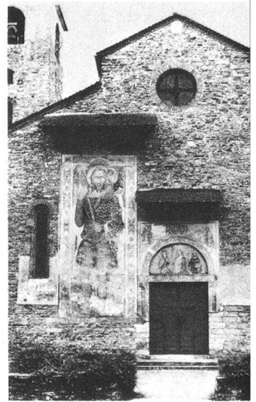
1 Ravecchia, S. Biagio, Fassade.

Die Forschung der Malerei in der Lombardei, speziell die des Mittelalters, ist verhältnismässig jung. Dies ist insofern kaum erstaunlich, wenn man sich in Erinnerung ruft, wie sehr die italienische Kunstgeschichtsforschung in ihrer Konzentration auf die berühmten toskanischen Künstler von Giorgio Vasari konditioniert wurde. Bereits im früheren 19. Jahrhundert bekundete der grosse toskanische Archivforscher Gaetano Milanesi darüber sein berechtigtes Unbehagen, wenn er darauf hinwies, dass die kunstgeschichtlichen Interessen zu stark von der Autorität des Aretiners dirigiert wären 1 . Um so grösser ist deshalb Johann Rudolf Rahns und Pietro Toescas Verdienst, um die Jahrhundertwende die Malerei des Tessins bzw. die Kunst der Lombardei in Pionierarbeit erstmals systematisch erforscht zu haben 2 . Ein Hauptproblem, das sich den nämlichen Forschern stellte und mit dem wir uns noch heute auseinandersetzen haben, ist die magere Quellenlage zur Kunst in diesem Gebiet. Bei Erhebungen zu Kunstwerken in der Lombardei können wir uns nur selten auf gesicherte Fakten abstützen; zudem sind die namentlich bekannten lombardischen Künstler äusserst rar. Wegen der geringen Zahl von Tafelbildern des lombardischen Trecento beschränken sich unsere Erhebungen zur Malerei im Einzugsgebiet von Mailand auf die in den verschiedenen Kirchen erhaltenen Freskenfolgen sowie auf ein-