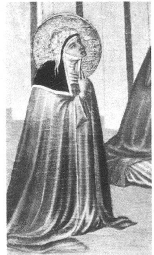
3 Pietro Lorenzetti, Altar der Seligen Umiltà (Ausschnitt), Florenz, Uffizien.

Der einzige mit Namen bekannte Lombarde von Profil, Giovanni da Milano , oder präziser Giovanni da Caversaccio (Como), begab sich schon in jungen Jahren nach Florenz 5 , weshalb sich in seiner Heimat keine Werke erhalten haben, die ihm mit guten Gründen zugeschrieben werden könnten 6 . Auch wenn er aus diesem Grunde eher der florentinischen als der lombardischen Malerei zuzurechnen ist, darf ihm in der norditalienischen Malerei doch eine nicht unerhebliche Funktion in der Vermittlung der toskanischen Kunst zuge- traut werden. Ungeachtet der dominierenden zentralitalienischen Einflüsse sind in der Kunst der Lombardei auch Tendenzen aus dem Veneto und der Emilia Romagna spürbar. Die Frage ist deshalb berechtigt, ob angesichts ihres komplexen und eklektischen (nicht im pejorativen Sinn) Charakters überhaupt von lombardischer Malerei die Rede sein kann, oder ob lombardische Kunst – zumindest die des 14. Jahrhunderts – nicht eher als ein geographisch diktiertem Begriff zu verstehen ist. Diese Frage lässt sich möglicherweise an den Fresken in S. Biagio in Ravecchia beantworten.