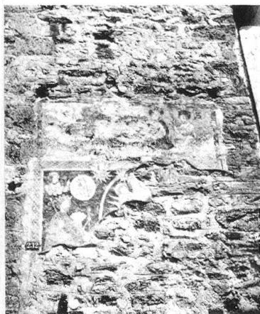
1 Vue d'ensemble de la peinture murale sur la tour de l'église paroissiale St-Martin à Ilanz.

La fresque extérieure sur la tour de l'église St-Martin à Ilanz, n'est plus, aujourd'hui, qu'un fragment mutilé. Elle dévoile cependant une iconographie originale et un contenu théologique complexe. En illustrant un moment clef de la vie d'un saint, cette peinture murale jette une lumière sur toute une conjoncture politique et ecclésiastique des Grisons au 15 e siècle. Exposée non seulement à la vue des fidèles, mais à celle de tous les passants, elle doit être considérée comme un vrai «monument public».