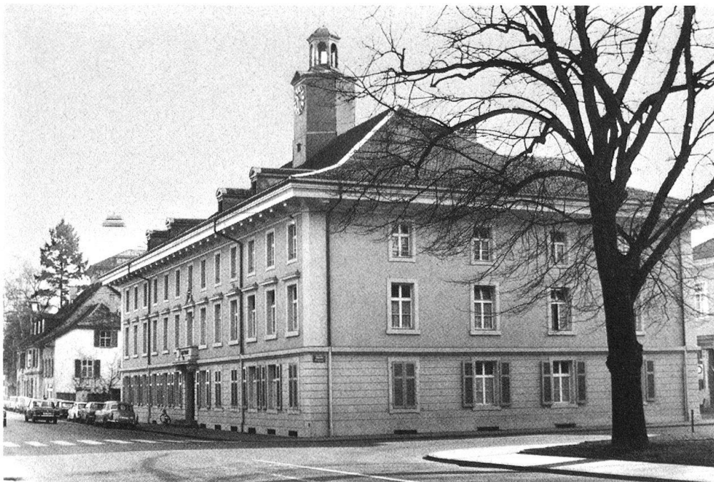
2 Aarau, Laurenzenvorstadt. Altes Spital, heute Amtshaus, erbaut 1779 von C. A. v. Sinner. Aufnahme nach Aussenrenovation 1972.

es, lästige Verzerrungen aufzuheben, die Augenhöhe des Photographen ist nicht mehr Fixpunkt für die Aufnahme. Die Teleobjektive von fast unbeschränkter Brennweite gestatten es, völlig neue Blickrichtungen auf ein Denkmal zu wählen und, was vielfach willkommen ist, all das Unansehnliche zwischen Betrachter und Objekt zu überbrücken.