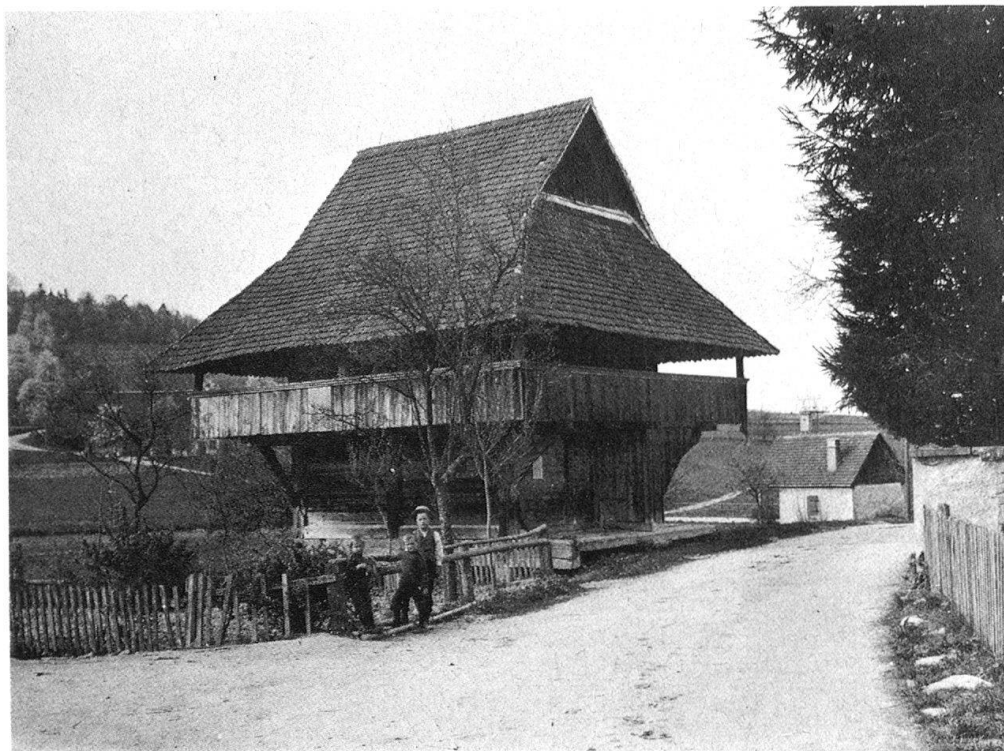
5 Ammerswil, Pfundspeicher, datiert 1685. Alte Aufnahme von 1918.

Arbeiten, von der Planung bis zur Realisierung, lässt sich eine systematische Photodokumentation schon besser vorstellen. Leider aber werden die einzigartigen Chancen – wie zum Beispiel Gerüste und Bauinstallationen für Aufnahmen auszunützen – noch allzuoft verpasst. Einmalige Einblicke bei Freilegungen und Demontagen verstreichen ungenutzt. Solange die Dokumentation nicht ein fester Bestandteil der Termin- und Kostenplanung ist, darf uns dies auch nicht erstaunen.