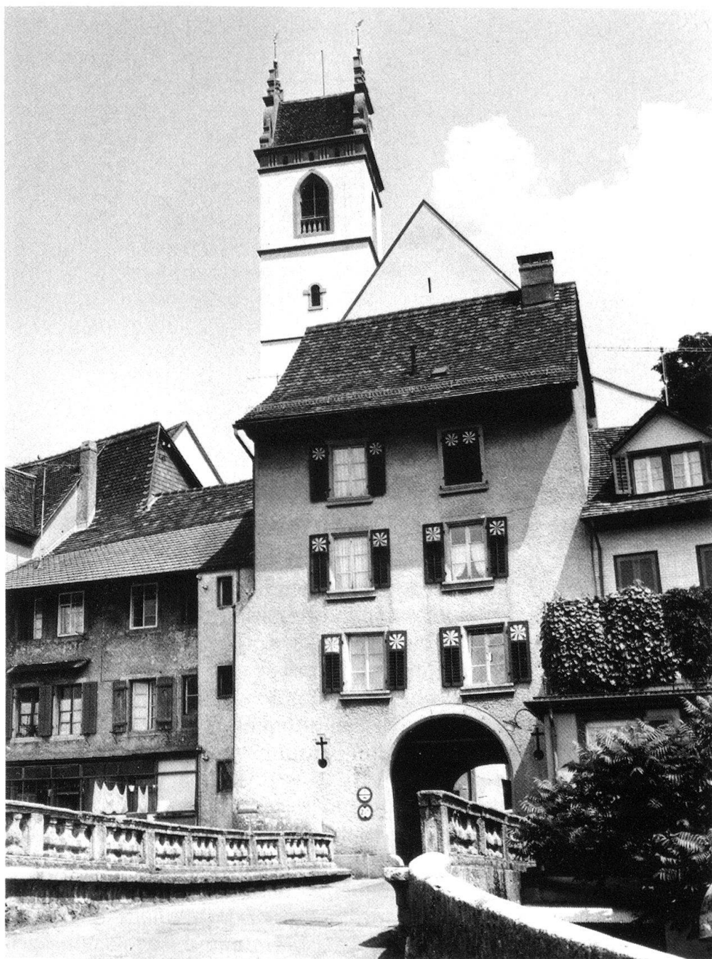
4 Aarau, das Haldentor. Aufnahme 1966.

nen und Zahlen. Der einfache Gebrauch der modernen Photoapparate erleichtert den Einsatz der Photographie als Dokumentationsmittel – was läge demnach näher, als dieses Instrument systematisch und methodisch einzusetzen?