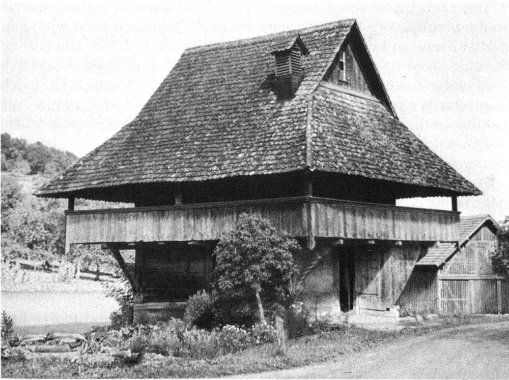
6 Ammerswil, Pfrundspeicher. Aufnahme für Kdm AG II, 1952, S. 12.

derungen unserer gestalteten Umwelt ist schneller geworden. Wir haben uns daran gewöhnt, unsere Anpasszeiten haben sich verkürzt – die Gewöhnung trübt den kritischen Blick. Um so notwendiger ist ein laufendes photographisches Protokoll. Nur so erhalten wir eine vergleichende Visualisierung von Veränderungen, und nur so ist letztlich eine Beurteilung dieses Prozesses möglich.