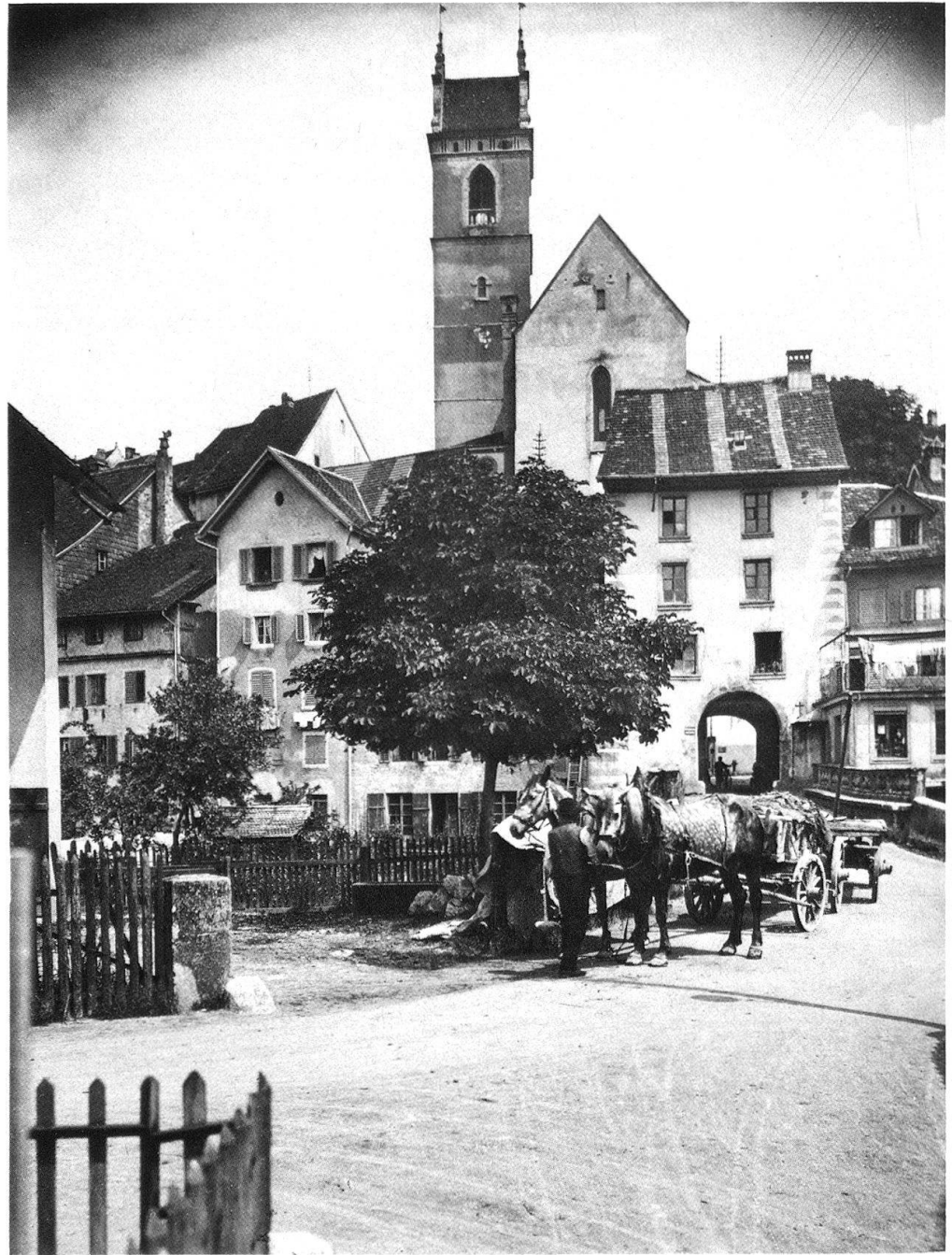
3 Aarau, das Haldentor. Nachfolgebau eines Torturms. Bauzeit zwischen 1612 und 1665. Aufnahme aus der Sammlung Wehrli, um 1920.

Heraussuchen eines unbeschadeten Ausschnitts ist ein Vertuschen der tatsächlichen Zustände – ein möglicherweise folgenschwerer Selbstbetrug. Abgesehen von den immer seltener gewordenen idyllischen Inseln, ist die Nachbarschaft unserer Denkmäler beladen von Einrichtungen des Verkehrs, der Kommunikation, der Versorgung und oft am aufdringlichsten von opulenten Werbe-Installationen. Die Blickkontrolle zeigt sofort, wie eng der Umgebungsschutz-Perimeter unserer Schutzobjekte geworden ist. «Das Denkmal im Bild» wird zum kunstgeschichtlichen Protokoll!