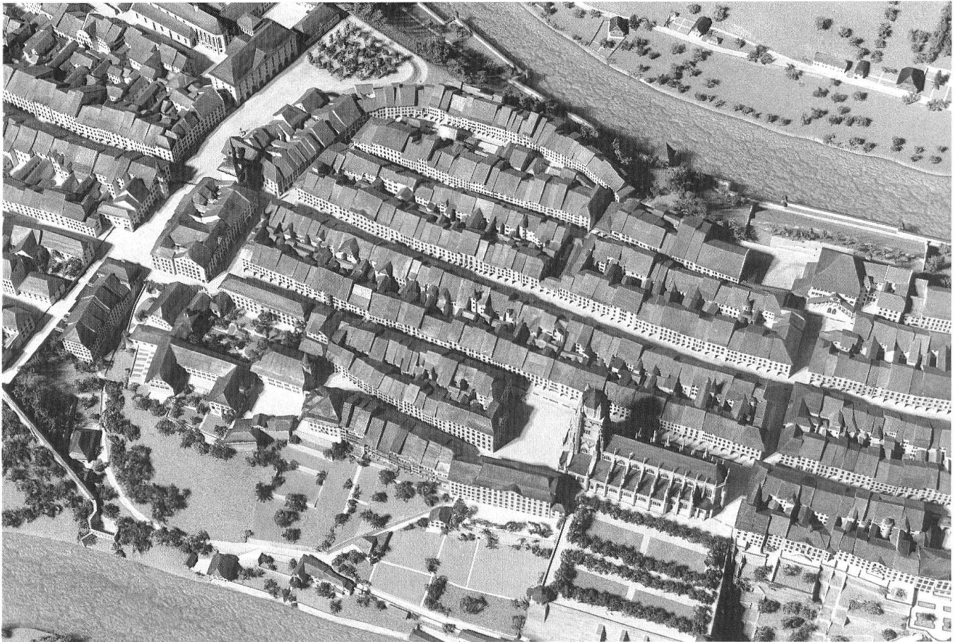
4 Berne vers 1800: l'aire de la première extension, vue du sud.

née 9 . Ces maquettes se fondent sur des documents contrôlés; elles contiennent cependant une part conjecturale, puisque l'idée d'un état complet et certain est absurde: impossible de saisir l'ensemble d'une ville à un moment précis du passé; on a toujours affaire à une approximation. Laquelle peut varier de beaucoup: la grande maquette de la Rome constantinienne, à l'EUR, est largement hypothétique en ce qui concerne les zones d'habitation tandis que le modèle de Rorschach à la fin du XVIII e siècle, qui transcrit un plan de 1790 et une vue à vol d'oiseau publiée quatre ans plus tard, possède un enviable degré de vraisemblance historique.