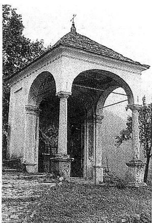
2, 3 Comologno, Via Crucis. Le Stazioni XIII e XIV.

cura delle donne e dei ragazzi) e all'emigrazione degli uomini più validi. Tuttavia, qualche santo protettore ha voluto che fra gli emigranti che nel '700 presero, come molti prima e dopo di loro, la via della Francia, vi fossero alcuni Remonda che, a Parigi, a Bourges, Etampes, Auxerre, Orléans..., grazie alla loro intelligenza e, forse, a un senso degli affari purtroppo abbastanza raro fra i convallerani, fattisi da cenciaioli colporteurs e poi mercanti di stoffe, furono in grado di accumulare ricchezze e di salire nella scala sociale fino ad essere nobilitati (un discendente di una di quelle famiglie, generale nelle armate napoleoniche, sarà fatto barone dell'Impero).