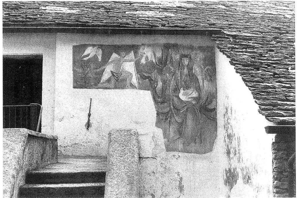
6 Comolugno, Chiesa parrocchiale. L'Annunciazione di Sergio Emery. 1966.