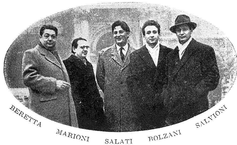
8 Il gruppo dei «Pittori della Barca», 1952.

animosa. Inutile dire che nessun angelo prestò ascolto a quel desiderio, che l'impresa di Comologno non trovò molti imitatori... Toccò ancora una volta alla gente di lassù, agli «Amici di Comologno», tornare alla carica e riprendere l'animoso discorso...».