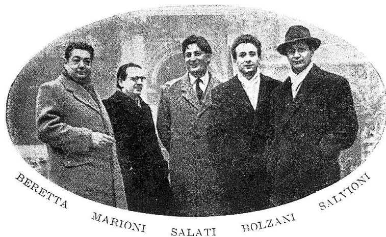
8 Il gruppo dei «Pittori della Barca», 1952.

animosa. Inutile dire che nessun angelo prestò ascolto a quel desiderio, che l'impresa di Comologno non trovò molti imitatori... Toccò ancora una volta alla gente di lassù, agli «Amici di Comologno», tornare alla carica e riprendere l'animoso discorso...».