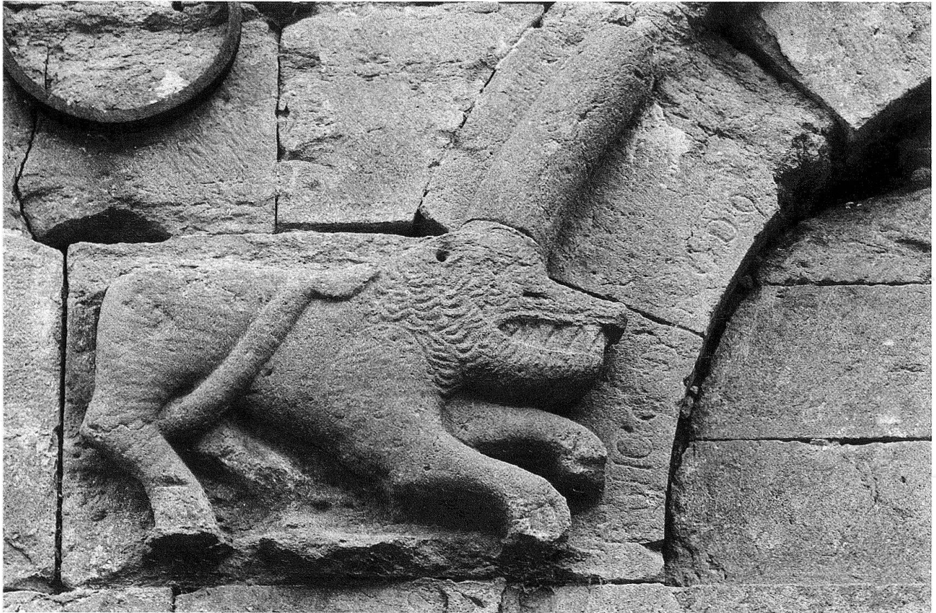
3 Schöntal, Westportal, Löwe am linken Bogenansatz.

bar, der aufgrund seiner Physiognomie zu einer Raubkatze gehören dürfte. Zu diesen figürlichen Elementen kommt in der linken Bogenhälfte eine leider stark beschädigte Inschrift, deren Lesung «+ HIC EST RODO» bislang nicht restlos gedeutet werden konnte 3 .