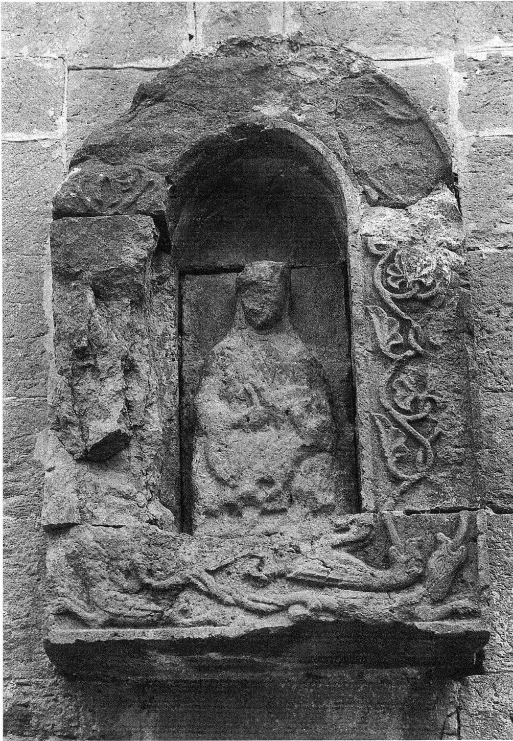
6 Schöntal, Marien- tabernakel nördlich des Westportals.

Errettung des bedrohten Mutter-Sohn-Paares anspielen, in Schöntal dagegen durch mehrere Drachen, die als Abbreviation für die siebenköpfige Bestie der Johannesoffenbarung verstanden werden können. Theologisch wird diese hier postulierte Interpretation abgestützt durch die sich im Laufe der zweiten Hälfte des 12. Jahrhunderts unter dem Einfluss vor allem der bernhardinischen Theologie durchsetzende mariologische Auslegung des Apokalyptischen Weibes, welche die ältere, ekklesiologische Deutung zunehmend in den Hintergrund drängte 11 . Bernhard von Clairvaux sah im Apokalyptischen Weib nichts anderes als das Zeichen der Überwindung des Teufels durch Maria 12 . Erst diese Entwicklung ermöglichte eine Iso-